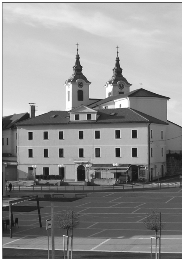
Mlinški dvor (Mühlhofen) v Postojni.