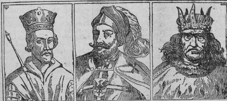
König Wladislaw Jagello von Polen, Hochmeister Ulrich von Jungingen, Grössfürst Witowd von Litauen. Zum 500. Jahrgedenktage der Schlacht bei Tannenberg

enberg v dotiko. Armada viteškega reda reda je bila vsled dolgega potovanja hudo utujena. Vkljub temu je krilo litavske armade popolnoma premagala. Ali nasledovali so sovravnike prehudo. Potem je glavna poljska armada, ki je bila poleg tega veliko številnejša, armado reda popolnoma premagala. Poleg zapovednika mojstra Ulrika je našo v tej bitki več kot 300 vodij nemškega viteškega reda svojo smrt. Mrliče so pokopali v leseni cerkvi v Tannenbergu, ki jo je še danes videti. Tam, kjer je veliki mojster Ulrik v boju proti divjakom svojo smrt našel, postavili so kapelico, ki se je pa pozneje podrla. Danes se vidi od te starodavne kapelice le še kamnenje fundamentov. Od prostora, kjer je stala kapelica, vidi se prav lepo celo pokrajino nekdanjega bojišča. Leta 1901 so postavili na tem kraju velikanski kamenski spomenik... Na naših slikah vidimo najprve ta kame-