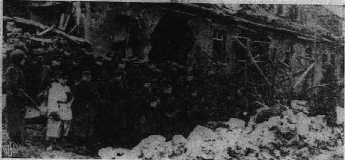
Ameriški vojaki morajo opravljati raznovrstna dolžnosti. Tukaj morata dva naša vojaka — eden na levi, drugi na desni — opravljati nalogo, ki jima je posebno ljuba. Stražita namreč namške ujetnike, ki so bili ujeti, ko so naši razbili hišo, v kateri so se ti Nemci nahajali, v Schonesseiffen. Temu kraju so dali zdaj ime "Heartbreak Crossroads", to je križišče ali razpotje trpljenja, ker so se tukaj vršili bridki boji.

domov, povejte vse, slabo in dobro. Mi vemo, da v Sovjetski Uniji ni vse dobro." Poročevalci so popraševali polkovnika tudi glede razširjanja ruskega komunizma. Glede tega je dejal, da Rusi so zainteresirani za enkrat le v zaščito miru. Drugo jih ne zanima. Glede Poljske so Rusi mnenja, da bo lahko vsestransko napredovala, toda ker je pred ruski vrati, se Rusija mora zanimati za njo, ker Poljska tvori pač vhod proti Rusiji. Rusi ne želijo posegati v zadeve na zapad, so pa odločni in strogi, kaj se godi in kako se ureja svet okrog njih.