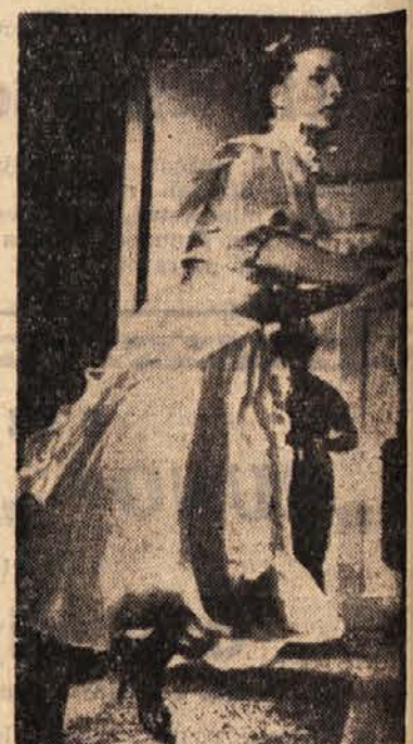
Katharine Hepburn kot Lizzie Curry v filmu »Umetni dež«