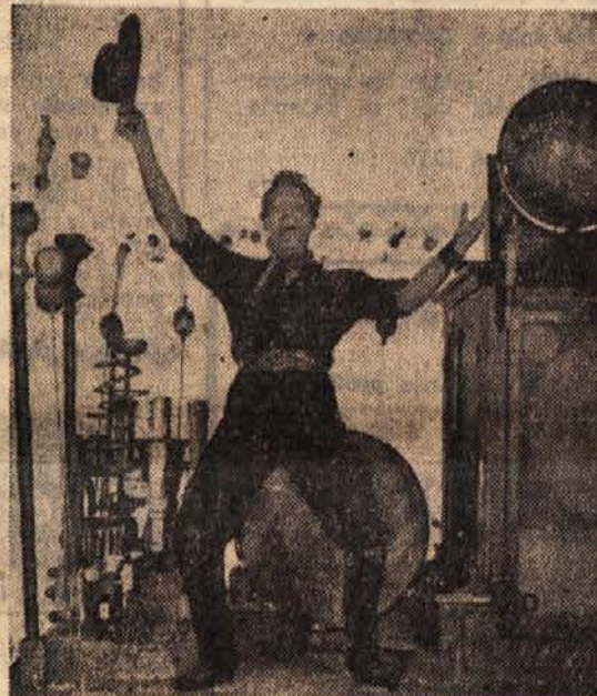
Burt Lancaster v vlogi Starbucka, ki zatrjuje, da bo napravil dež.