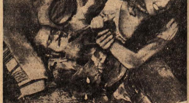
V Hollywoodu snemajo filmsko kriminalko »Jeza nazaj«. Posnetek kaže Lito Milan, ki je napadla stražarja, ko je ta hotel aretirati moža, ki ga je ljubila.

Ob takih in podobnih novicah, ki zadevajo večinoma čisto zasebno življenje, sta razumljiva jeza in preplah pri ljudeh od filma ter njihova grožnja, da bodo po posredovanju sodnije zahtevali odškodnino.