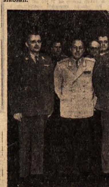
Delegacija JLA pod vodstvom državnega sekretarja za narodno obrambo generala armije Ivana Gošnjaka je že teden dni na obisku v Sovjetski zvezi. V tem času si je ogledala vrsto sovjetskih vojaških naprav in ustanov. Na sliki naša delegacija v družbi sovjetskih generalov in drugih višjih oficirjev v vojni akademiji »Frunze« v Moskvi