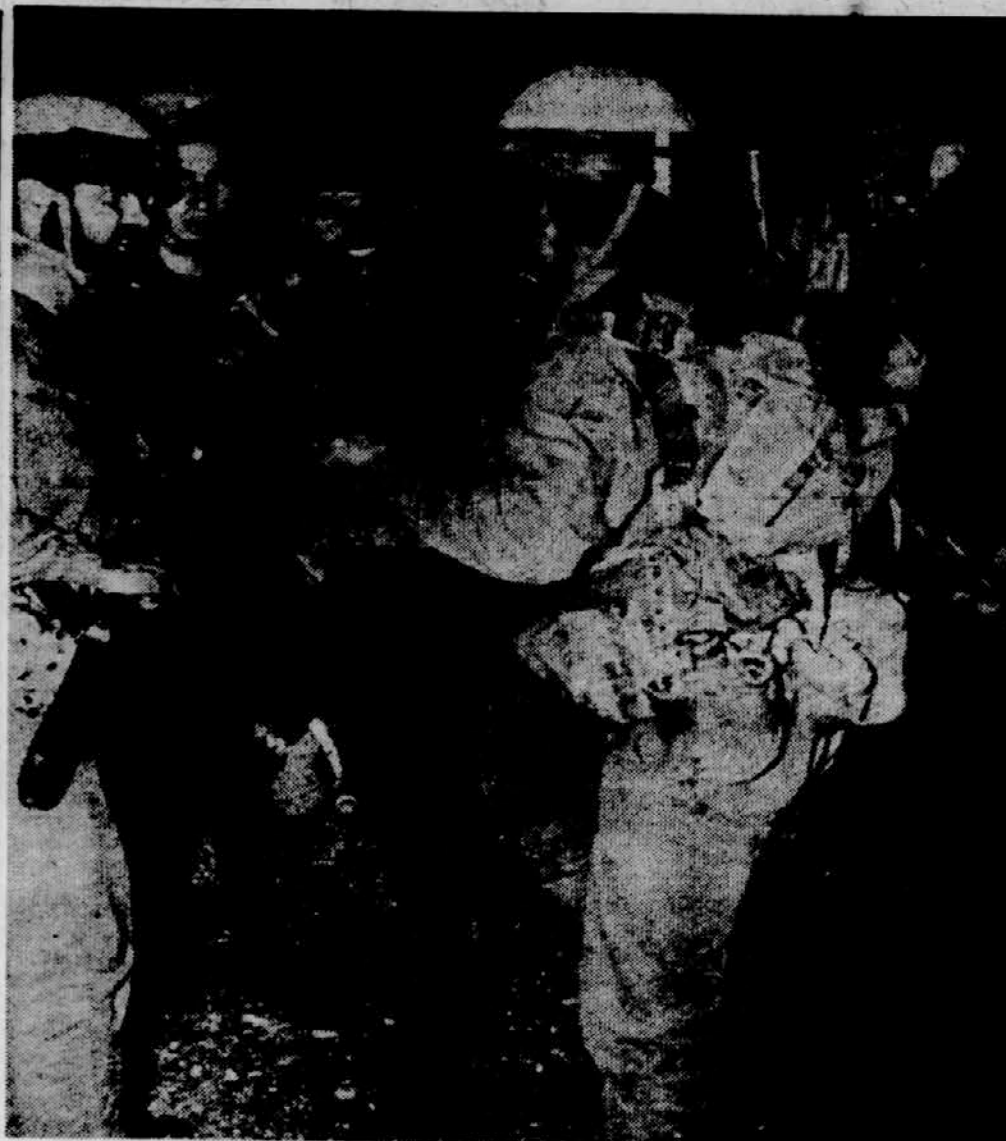
PO NAPADU NA LIBANON — Izraelski vojaki se vračajo po nspadu na libanonsko vas Kala, iz katere so odpeljali nekaj vojakov in civilistov kot povračilo za ubitve nekega Izraelca.

Ta ofenziva je še poslab- šala že tako hud položaj, kar zadeva prehrano biafrskega prebivalstva. Nevarnost lake- te je še bolj resna kot do- slej. Pomankanje živil je povzročilo precejšnje podraži- te hrane.