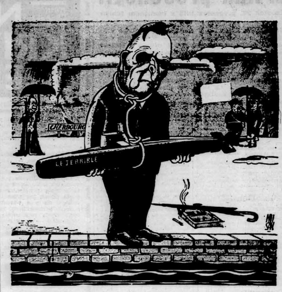
Francija je splavila še eno atomsko podmornico "Le Canard Enchaîné", Pariz