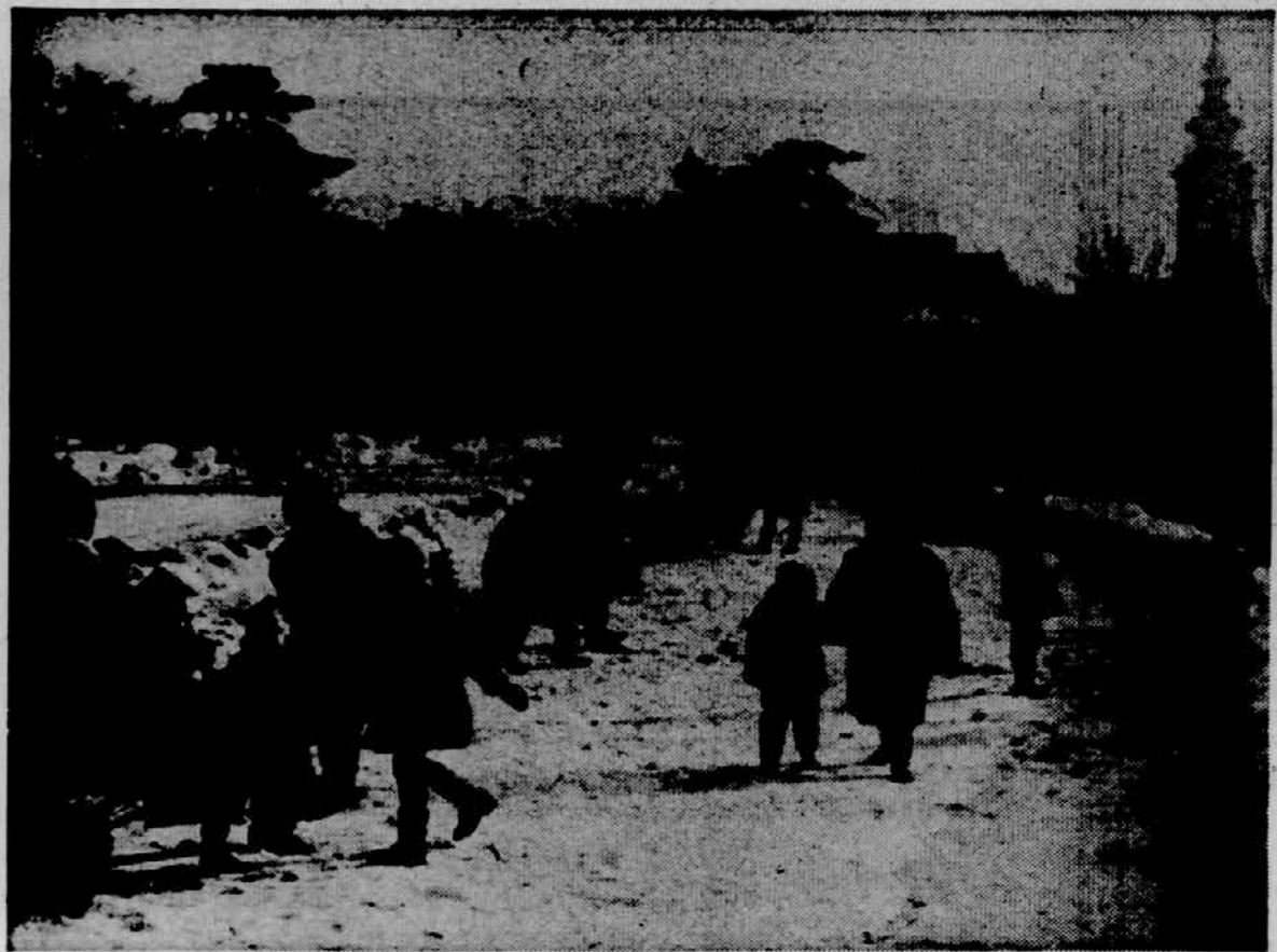
SONCNA SOBOTA V BEOGRADU — Sončno in mirno vreme je včeraj zabilo v parke in druge izletniške točke mnoge Beograđane. Med najbolj obiskanimi prehañališči je bil prav gotovo park na Kalenjegdanu, kjer je bilo toliko ljudi, ko da ni živo srebro zdriknilo pod ničlo. Odraslim sprehajalcem, pa tudi otrokom je sprehod po parku močno prijal.