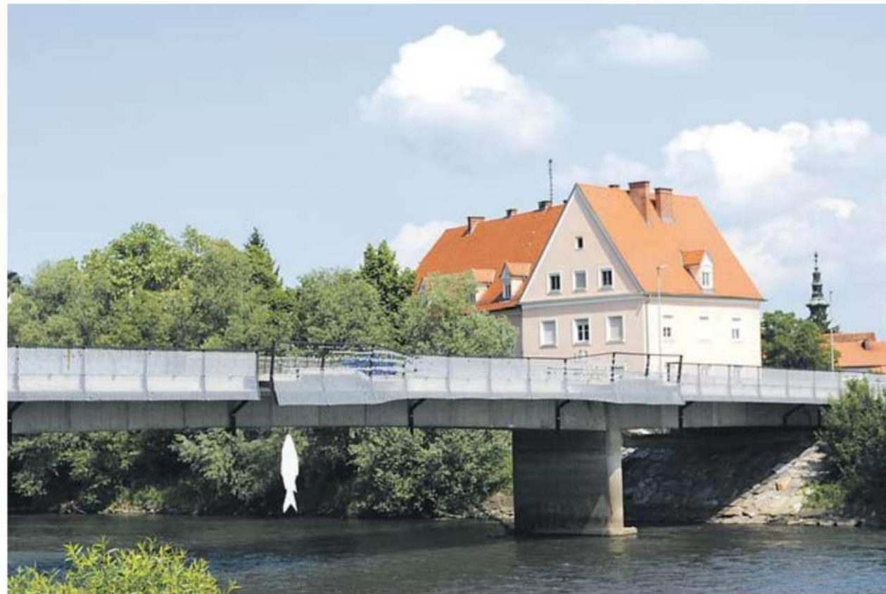
Celotno območje na levem in desnem bregu reke Mure, ki ju povezuje most, bo urejeno v območje oddiha, druženja ljudi in rekreacije.