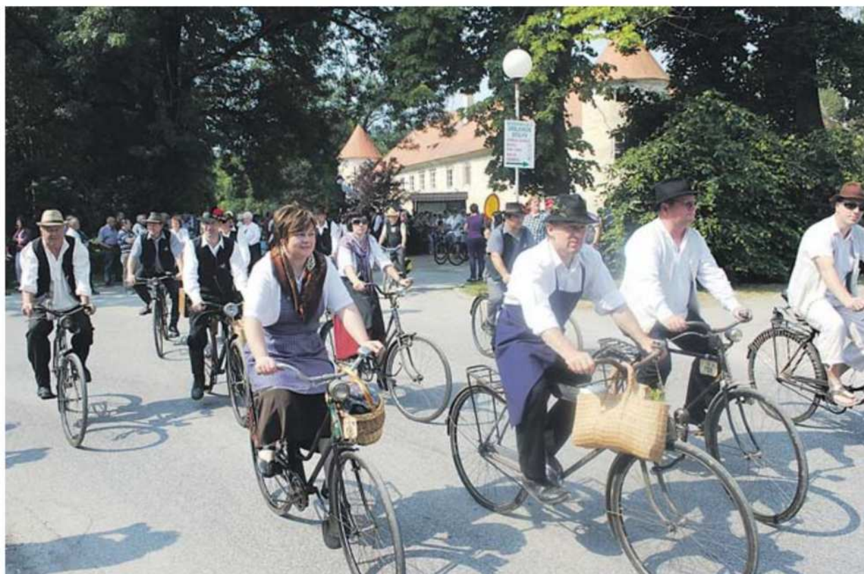
Kolesarji so se tudi letos popeljali na krožno pot, ki je bila dolga dvajset kilometrov, izpred gradu v Beltincih.

Reli je tako že deveto leto prijetno, rekreativno druženje ljubiteljev starih vozil in zbirateljev drugih starin iz Prekmurja, Prlekije, Štajerske, Gorenjske, Dolenjske, Brkinov in medžimurske Koprivnice, ki so bili oblečeni tudi v oblačila, značilna za njihove