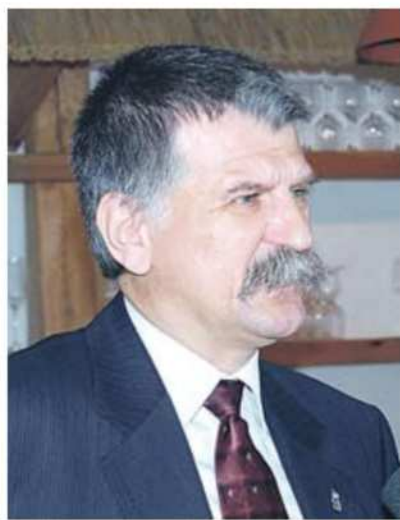
Laszlo Köver: »Mislim, da ne gre za tako težka vprašanja, da jih ne bi mogli rešiti.«