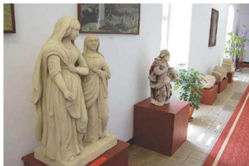
Razstavo so uredili na stranskem hodniku, ki so ga pred tem obnovili.

Med drugim so razstavljeni kipi, ki so bili nekoč postavljeni v Lendavi, Lendavskih Goricah in okolici, med njimi sta posebno zanimiva kip Janeza Krstnika in kip sv. Marije in Ane, pa tudi star počen zvon iz lendavske cerkve. V razstavo so vključili tudi več slik in drugih sakralnih predmetov, ki so bili doslej v skladišču lendavskega gradu ali v zasebnih zbirkah. Zbirko sakralnih predmetov so dopolnili še z razstavo starih zemljevidov, pa tudi