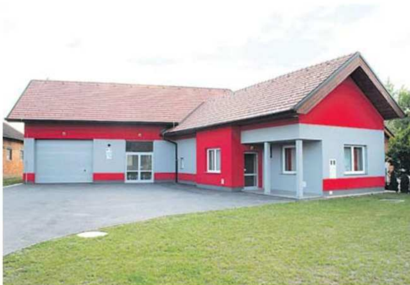
Medgeneracijski center v Mali Polani bo postal središče vaškega in občinskega življenja.