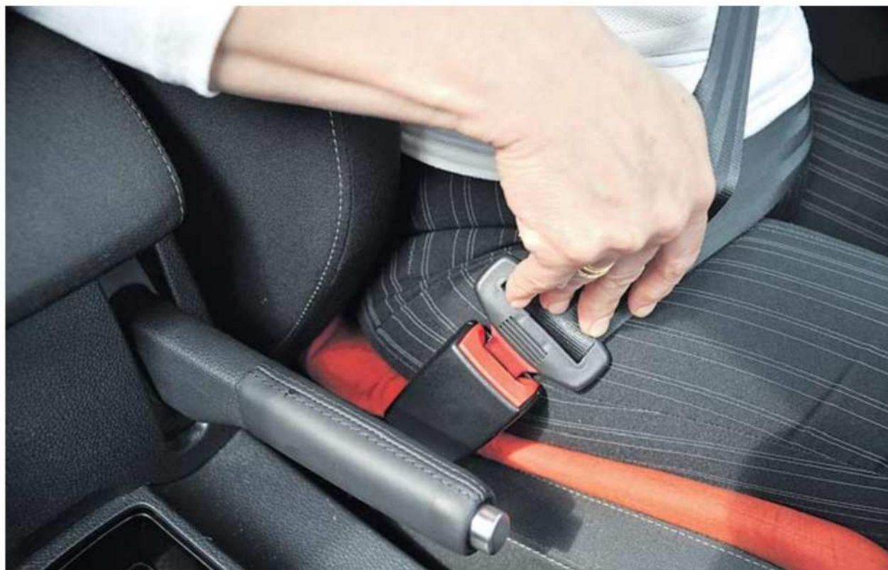
Uporaba varnostnega pasu dokazano rešuje življenja. Z močjo rok in nog bi se lahko zadržali v sedežu le pri trku s hitrostjo do sedem kilometrov na uro.

Uporaba varnostnega pasu je nujen sestavni del varne vožnje, saj je dokazano, da rešuje življenja.