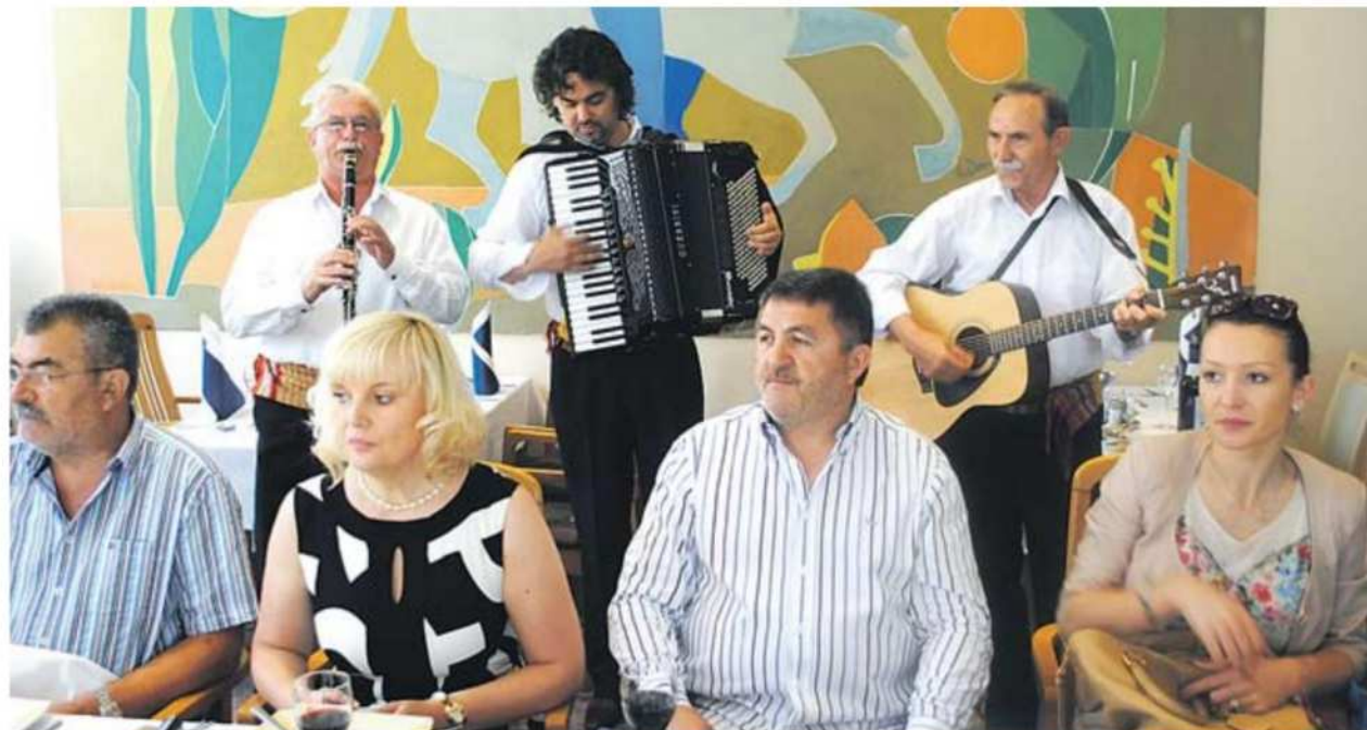
Predstavniki črnogorskega primorskega turizma so s seboj pripeljali tudi glasbenike, ki nastopajo v njihovih hotelih.

V oktobru se bo hotel Diana predstavil v črnogorskem hotelu Queen of Montenegro na dnevih prekmurske kuhinje