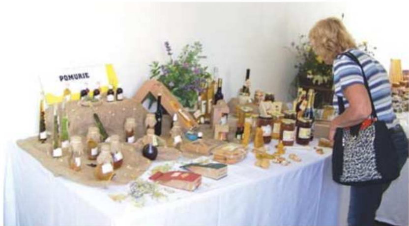
Na Dobrotah slovenskih kmetij na Ptuju so se predstavile tudi pomurske kmetije.

Na ogled je bilo več kot 1.100 nagrajenih izdelkov iz vseh slovenskih pokrajin, med njimi 135 iz Pomurja