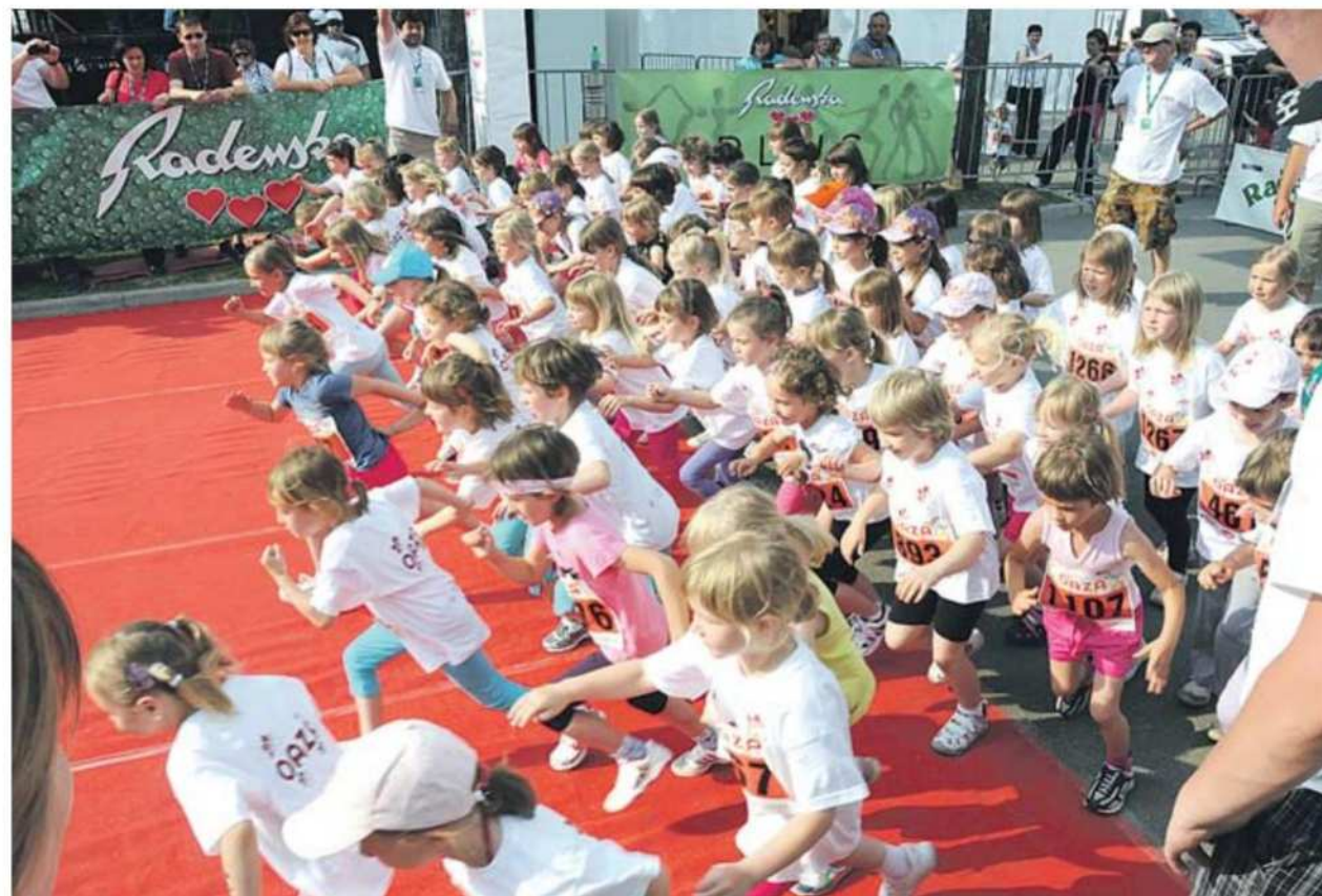
Tudi tek najmlajših je privabil veliko udeležencev.