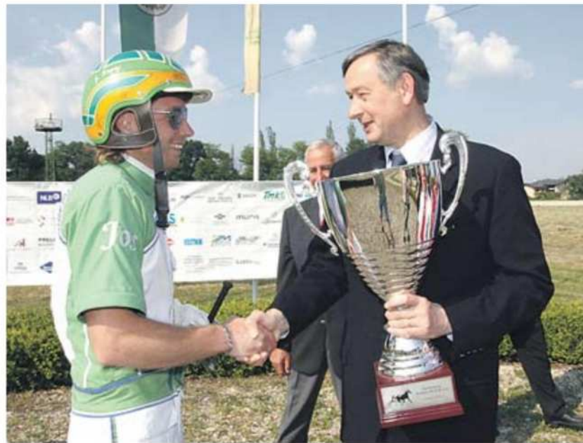
Sagaju pokal iz rok predsednika države

Za las do prestižnega pokala, ki mu ga je izročil predsednik Republike Slovenije dr. Danilo Türk