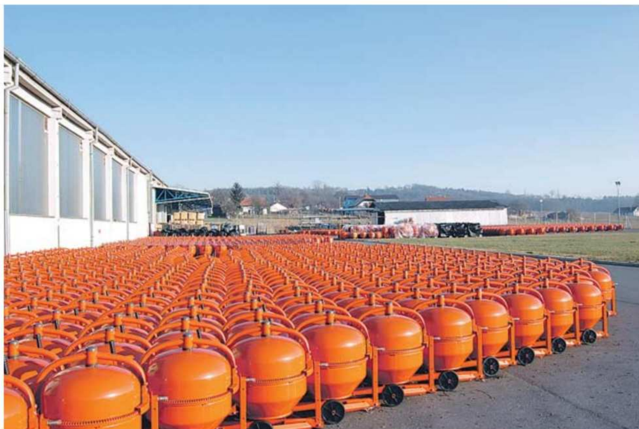
V najboljših letih je v tovarni pri Svetem Juriju na Goričkem delalo več kot 60 delavcev, ki so naredili na leto 50 tisoč mešalnikov. Zdaj jih dela 33, lani so izdelali 23 tisoč mešalnikov, prihodnost pa ni obetavna.

Nekateri so že ob prevzemu tovarne na Goričkem napovedovali, da ta ne bo imela dolgega življenja, pač pa z njenim nakupom francoski proizvajalec išče le nove trge. Črnogled napovedi se vsaj v prvih petih ali šestih letih niso uresničile, saj je proizvodnja v tovarni pri Svetem Juriju naraščala, novi lastniki pa so tovarno celo posodabljali. V poslovnem letu 2004/2005 so izdelali in prodali skoraj 31 tisoč mešalnikov, v naslednjem letu so proizvodnjo povečali za petino, v letih 2006/2007 in 2007/2008 pa so izdelali že več kot 50 tisoč mešalnikov. Po izbruhu svetovne finančne krize, ki se je kmalu prenesla tudi v realni sektor, pri Svetem Juriju beležijo padec povpraševanja, ki mu prilagajajo proizvodnjo, in lani so izdelali le še 23 tisoč mešalnikov. Za takšno zmanjša-