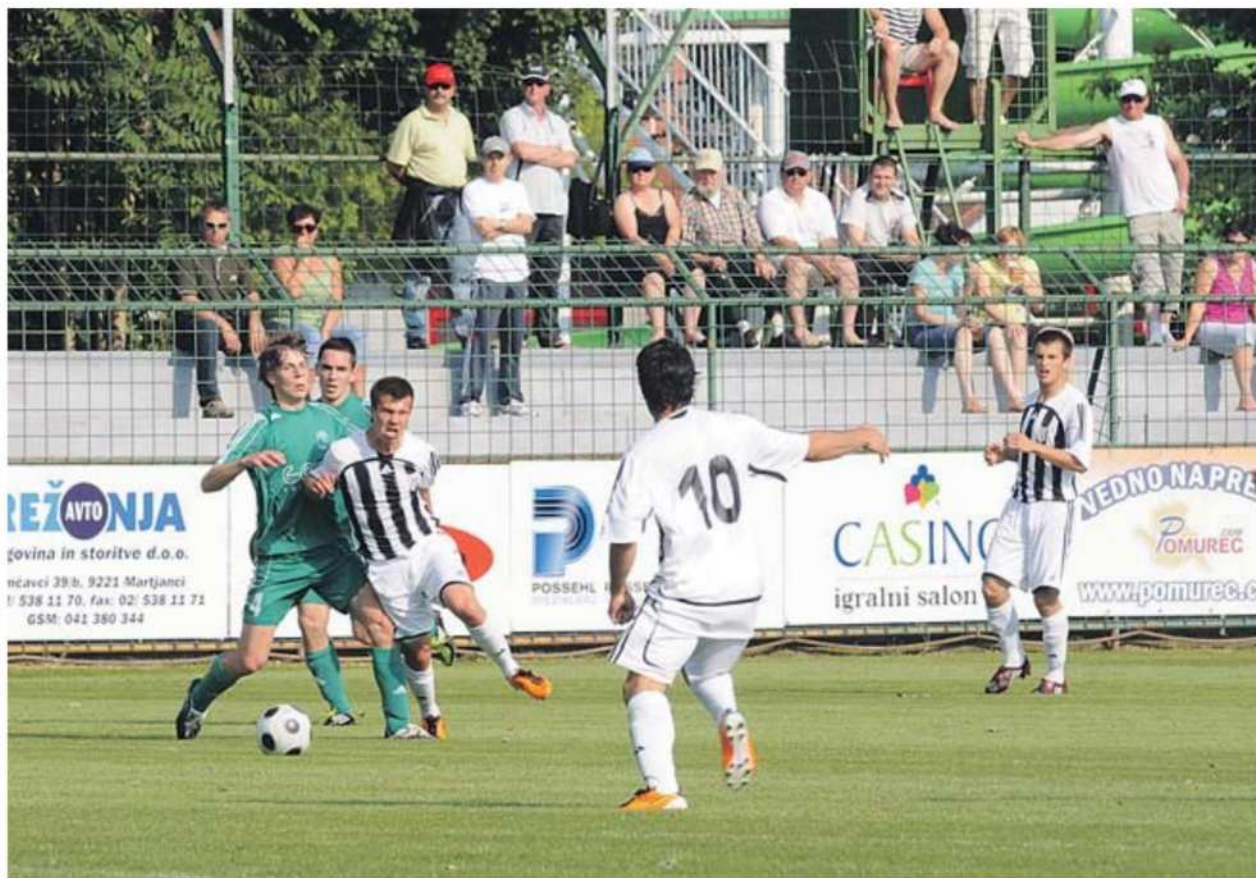
Bohar (v »sendviču« gostov) je bil dvakratni strelec.

Kljub vročemu soparnemu vremenu so črno-beli vse od začetka tekme dali vedeti, da tokrat ne bodo na lahek na-