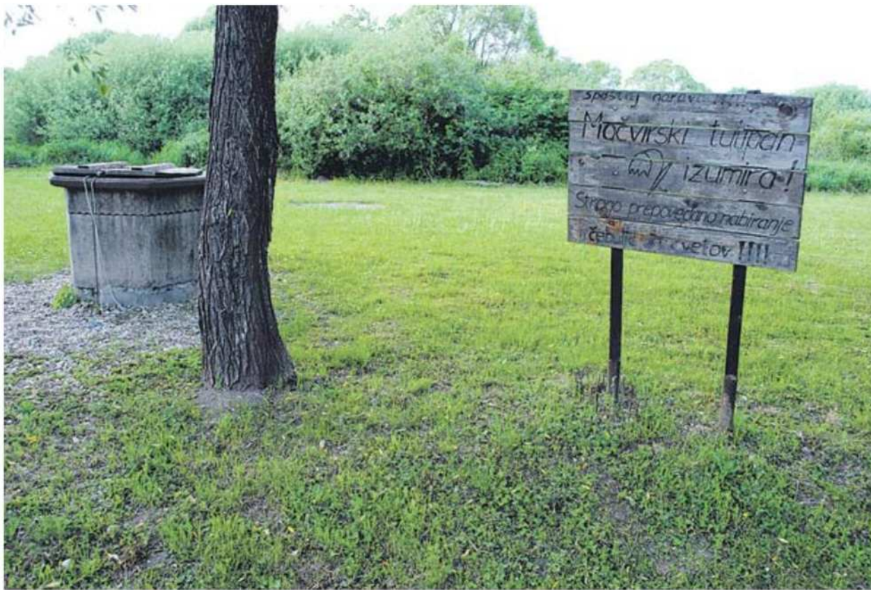
Polanski log je zatočišče za mnoge ogrožene rastlinske in živalske vrste.