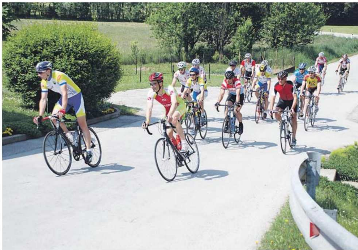
Prva skupina kolesarjev na 62-kilometrski progi