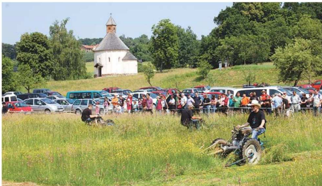
Tekmovalci so se pomerili tudi v košnji z motornimi kosilnicami.

Osrednja prireditev je bila v nedeljo, ko se je zbralo na prizorišču tekmovanja 51 koscev iz Slovenije, Srbije, Madžarske, Hrvaške ter Bosne in Hercegovine, tekmovalce pa so v sončnem in vročem vremenu bodrili številni gledalci.