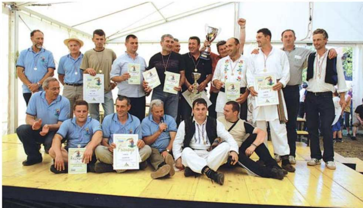
Najboljši na tekmovanju v košnji so prejeli priznanja, ekipa Republike Srbije pa pokal za zmago v štafetni konkurenci.