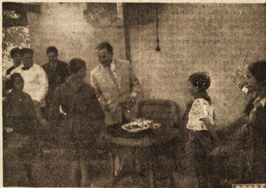
Maršal Tito v razgovoru s predstavniki beograjskih pionirjev, ki so mu pred »Tedom matere in otroka« izročili pozdrave in darila pionirjev.

beti za to, če imajo delavci stanovanja, plačo in ostalo, kakor je treba. Za izvršitev nalog, določenih v planu, imajo sindikati zelo velik pomen, enako kot je njihova vloga velika tudi pri dviganju produktivnosti dela. Pri nas se je velika množica ljudi zila in se bo vedno bolj zlivala v veliki industrijski kolektiv. To delovno množico je treba vzgojiti. Delo v tovarnah ni tako lahko, zamotano je in zadosti naporno. Sindikati morajo delavcem pojasniti vse, kar je potrebno s tem v zvezi. V tem pogledu smo s sindikati zadovoljni. Toda napačno bi bilo, če bi sindikati samo zahtevali nekaj, česar ni mogoče dati. Da bi mogli dati, je treba ustvarjati. Danes dela naš delavec zase. Pri nas ni kapitalistov, ampak gre vse prispevek v dobro ljudstva, za dvig njegovega življenjskega standarda. Jugoslavija je imela zelo nizek življenjski standard, in to tako delavci kakor tudi kmetje. Mi hočemo dvigniti življenjski standard našega ljudstva, hočemo, da bi naši ljudje razumeli in poznali mnogo boljši način življenja, kot si ga morejo zamisljati. Toda ni tako lahko privaditi ljudi, da bi živeli na višji kulturni stopnji, ker so se že navadili na en način življenja. Dokazati moramo, da je to malo, da to ni prav in da morajo imeti