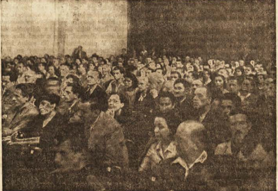
Občinstvo, ki je napolnilo razpravno dvorano, napeto sledi zaslišanju ustaških zločincev.