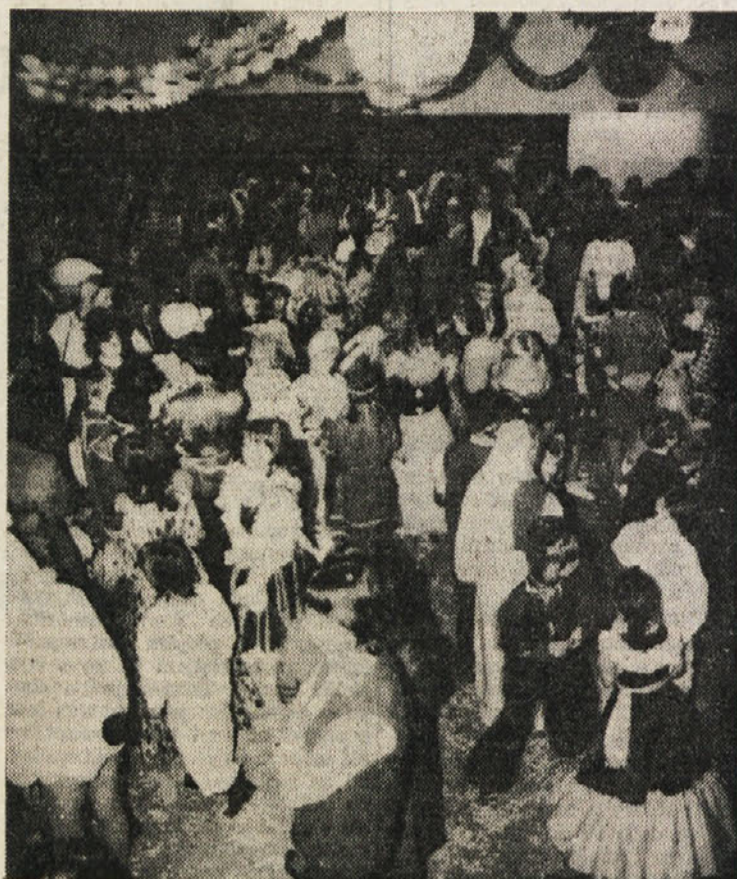
Otroško rajanje v boljunskem kulturnem domu