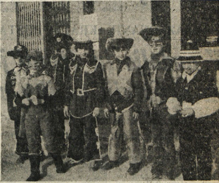
Na pustno soboto so se na sedežu kulturnega društva Brški gric v Števerjanu zbrali domači otroci in se pošteno pozabavali. Zvečer pa so pustovali starejši. Na naši sliki motiv popoldanske zabave