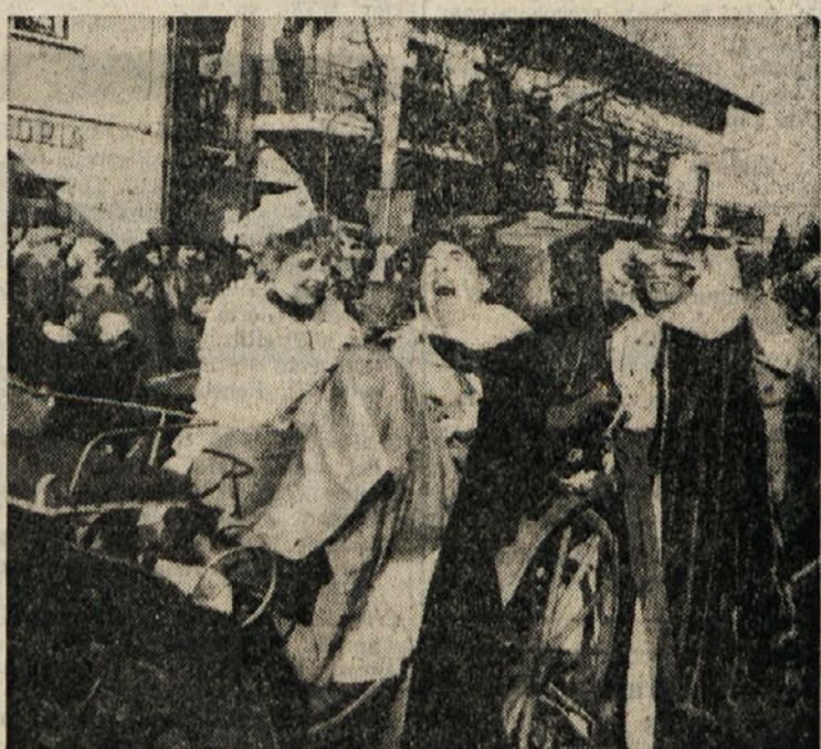
Openska kraljica in kralj letošnjega pusta sta bila v znaku stabilizacije, saj se jima je konj prehladil