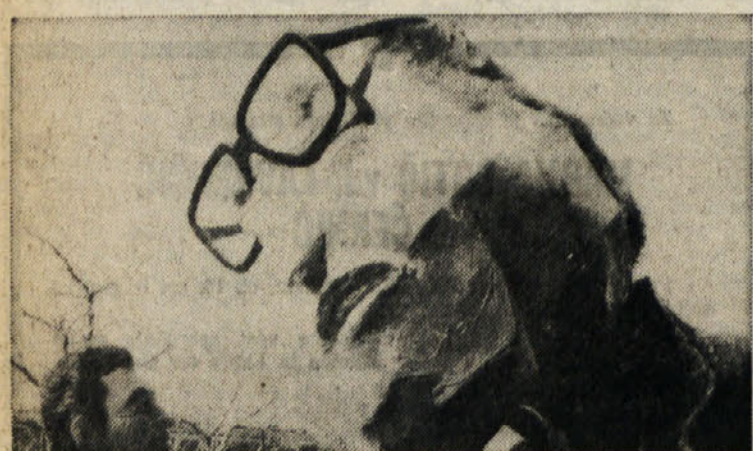
Voz iz Šempolaja je zasedel drugo mesto