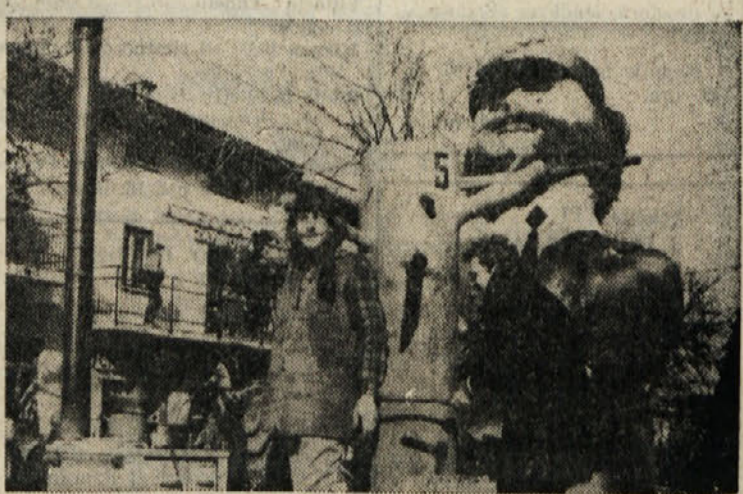
Openskega pusta so se udeležili tudi Nabražinci