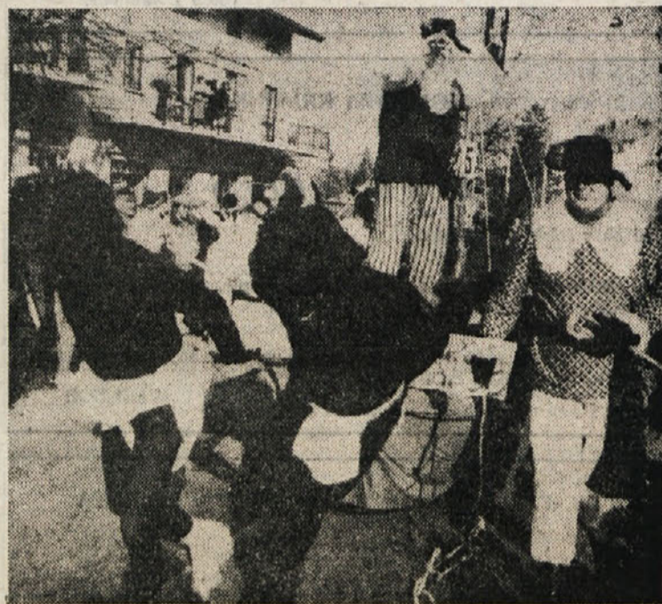
Od Ferlugov so protestirali nad krajo drv na Krasu