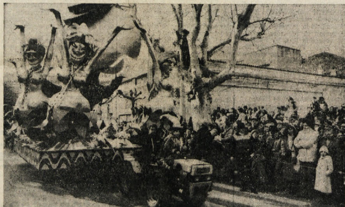
Voz skupine «Lampo» je prejel prvo nagrado v Miljah

prepričan, da bo z lahkoto odnesel zmago, ker je v svoji dovršenosti šel predalet, da je postal prikrajšan in premalo ljudski. In prav človeška toplina mora ostati glavna značilnost miljskega pusta, saj bi se v nasprotnem primeru pust izrodil v slabo kopijo Viaregia. To bo nevarno predvsem prihodnje leto, ko bo miljski pust praznoval svojo tridesetletnico. Že v nedeljo smo opazili take težnje, a bržkone bo slaba uvrstitve spametovala marsikatero finančno bogato skupino, da se bo vrnila v bolj ljudske razsežnosti.