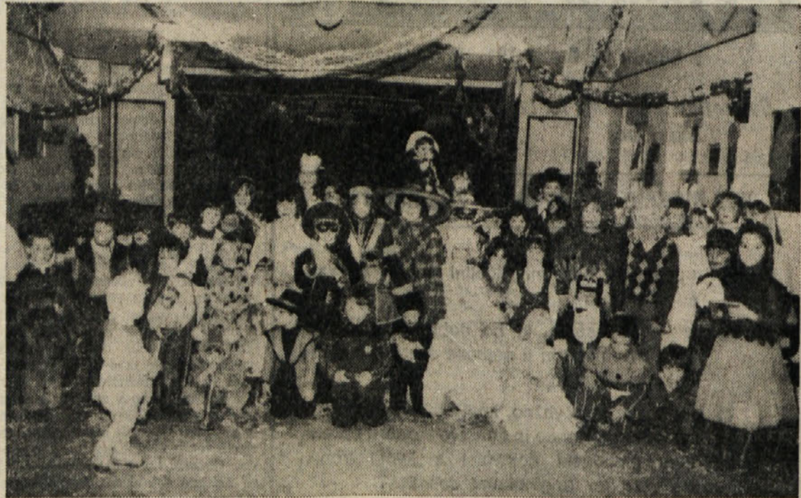
KD Slovenec iz Boršta je tudi priredilo otroško pustno rajanje