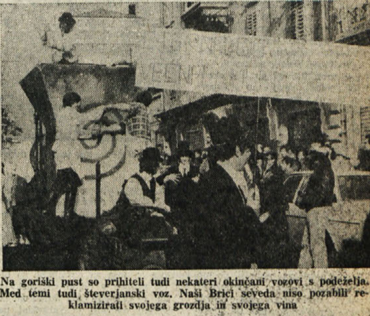
Na goriški pust so prihiteli tudi nekateri okrajni vozovi s podeljela. Med temi tudi števerjanski otroci in se pošteno pozabavali. Reklamirali svojega grozljiva in svojega vina