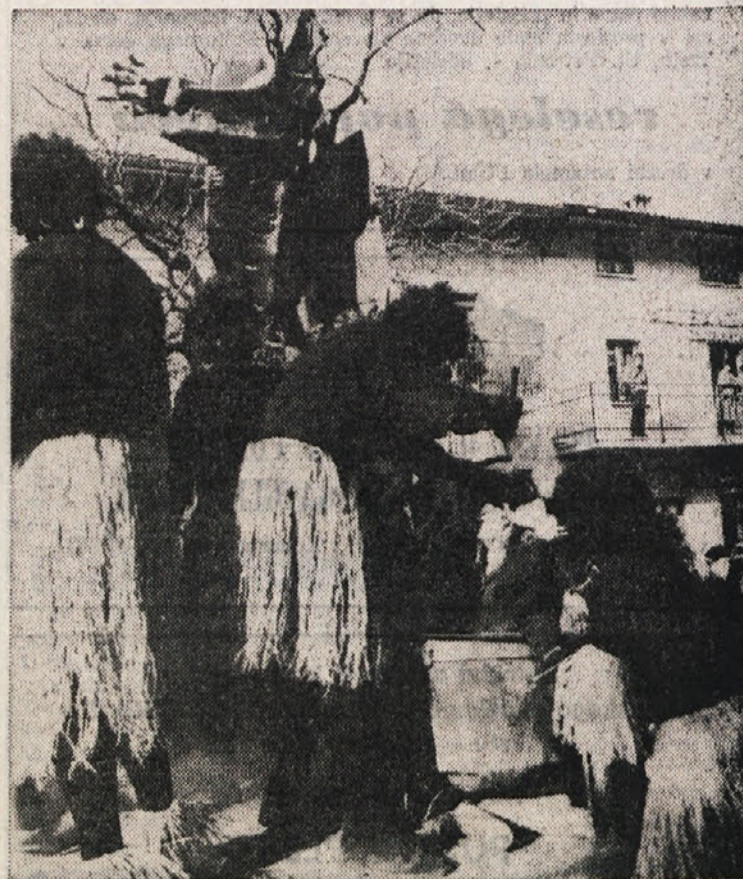
Tudi taki prizori so prijetno učinkovali

V EKSPLOZIJ BARV IN SAMBE «KARNEVALA V RIU... OSPU»