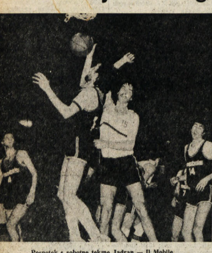
Posnetek s sobotne tekme Jadran - Il Mobile

V 16. kolu košarkarskega prvenstva C-1 lige je prišlo do velikih presenečenj.