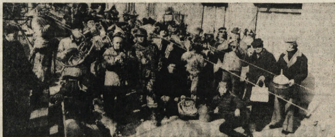
Takih prizorov, kot je bil v nedeljo v Mačkolljah, kjer se je zbrala skupina KD Primorsko, je bilo še več

Znano je, da si ob takih priložnostih dajejo duška tudi otroci, ki jih stari okinčajo v najrazličnejše kostume. Seveda, in v kostumi iz trgovin, za katere je treba odšteti težke denarce, žal, Nemara bi lahko to posvetili več skrbi domišljiji in ustvarjalnosti ter napravili take