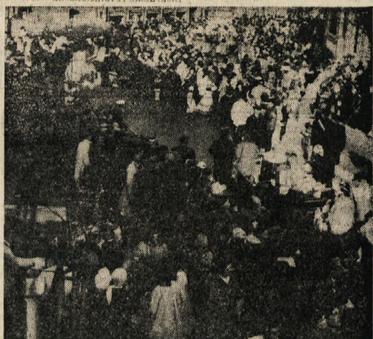
Sobotne prireditve na Opčinah se je udeležila večtisočglava množica