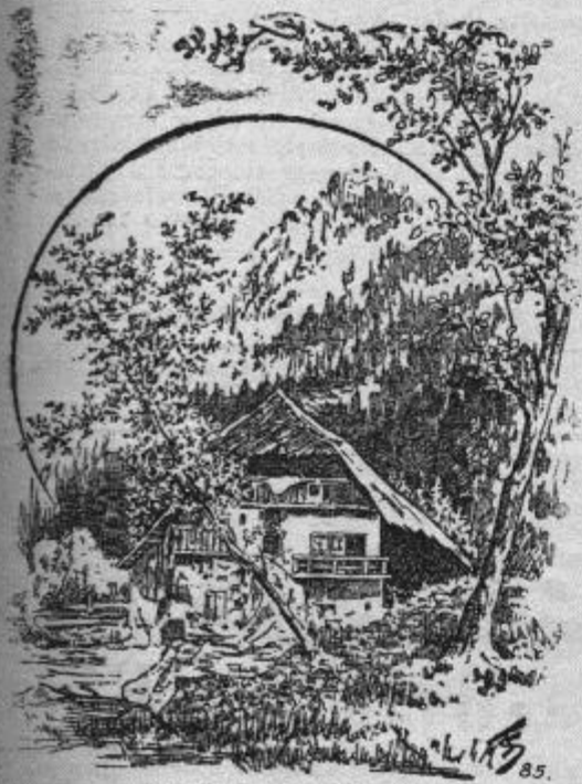
Wo ist die schöne Sennerin?