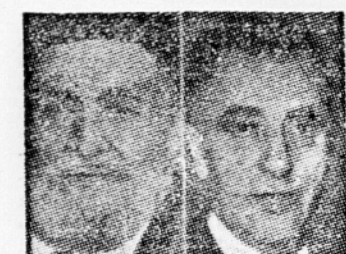
Kašani in Zahedi

V daljšem članku opisuje ameriške načine protikomunistične borbe in pravi, čeprav sodi, da so šli Američani »pri tem predalet«, da »Britanci niso šli dovolj daleč«. Nasprotnega mnenja je la-