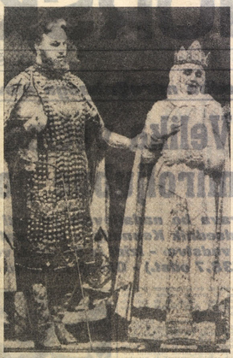
Tudi Borodinov «Knez Igor» je dosegel v milanski «Scali» v izvedbi moskovskega opernega gledališča «Bolšoj» zelo lep uspeh. Prave očuje je občinstvo pridelilo že v začetku, ko je orkester odpral uverturo. Tudi pozneje je poslušanje pozdravilo vsako posebej. — Na sliki prizor iz opere