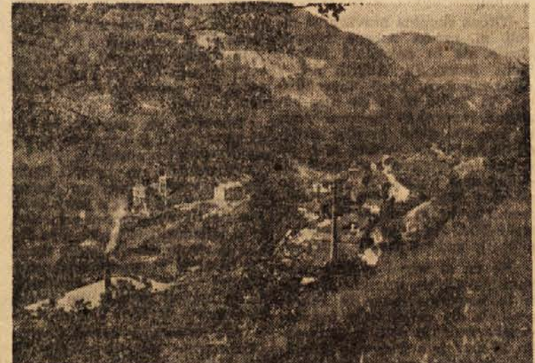
Pogled na hrastniško dolino s kemično tovarno in steklarno

Proizvodni načrt za prvo polletje je bil določen 3.110.000 kg steklenih izdelkov, v tem obdobju pa so prodali 3.247.000 kg izdelkov, nekaj na račun povečane proizvodnje, nekaj pa iz zaloge. Zlasti so povečali izvoz steklenih izdelkov v inozemstvo. Lani so izvozili 339.534 kg stekla, v letošnjih prvih mesecih pa že 223.928 kg. Podatki kažejo uspešno delo hrastniških steklarjev. Uspehi v proizvodnji pa bi bili lahko še večji, če ne bi bilo med kolektivom precej nediscipliniranih članov. Neupravičeni izostanki — nekateri posamezniki so v zadnjih štirih mesecih izostali tudi od pet do osemkrat — so delo v tovarni precej zavrli. Mnogi so odšli na delo v druge steklarne, ker jih drugje bolje plačujejo. Delavci niso izkoriščali letnega dopusta za oddih, marveč so v času dopusta delali v drugih tovarnah. Razen vseh teh