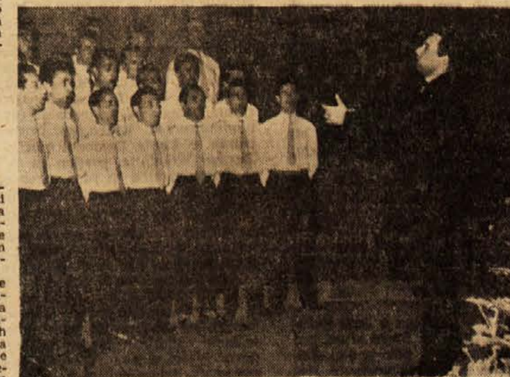
Nastop pevskega zbora »Vinko Vodopivec«