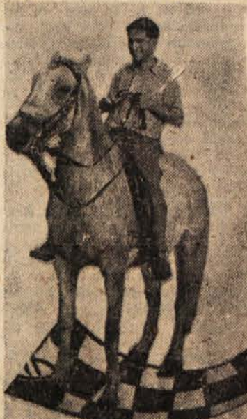
Talja zopet na konju... (Posnetek iz Lipice)

Bell: B. Larsen Cini: T. Petrosjan 1. f4, S16 2. S13, d3 3. e3, Lg4 4. Lc2, Sbd7 5. Se5, Lc2 6. Dc2, e6 7. 0-0, Ld6 8. d4, 0-0 9. Sd2, e5 10. c3 Td3 11. g4, Se2 12. Sd3, Sd5 13. Ld2, Se4 14. Le1, S7 15. Sd3, Le7 16. f5, Dd7 17. Sd4, S7 18. Lg3, Ld5 19. Ld6, Dd6 20. Tadi, Tce2 21. d.c. S:c5 22. S4, b5 23. Dg2, Td8 24. b4, Se4 25. f.e. g6 26. S:d5 (Larsen se brez bojazni spušta v zaplet), S:d5 27. D:c4, S:c3? (tale "podrežnost ima v sebi, kot kaže nadaljevanje, usodno kaj poraza) 28. Td6, S:e4 29. Td5, Td3 30. T:a7, Te8 31. Sg3, g5 32. Tc1, Td6 33. T:c7 (po tem trdnjavskem vdoru v črni tabor je Petrosjan izgubljen), Sd4 35. T:h7, Te8 36. Th7, Kh8 37. h5, Se8 (še nekaj konjskih skokov v zadnji agoniji) 38. Tg7, Sd6 39. Th7, Kg8 40. h5, Se8 Th7 in črni se vda, ker nima proti matni grožnji prav nobenega zdravila. Francé Gerželj