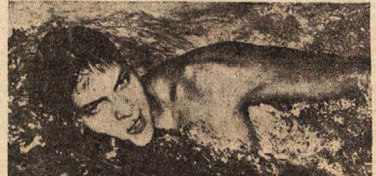
Italijanski plavalec Paolo Pucci je večeraj v polfinalu na 100 m prosto dosegel nov evropski rekord s časom 56,1

Naši vaterpolisti bodo drevi igrali a Poljaki, jutri popoldne pa z reprezentanco Vzhodne Nemčije.