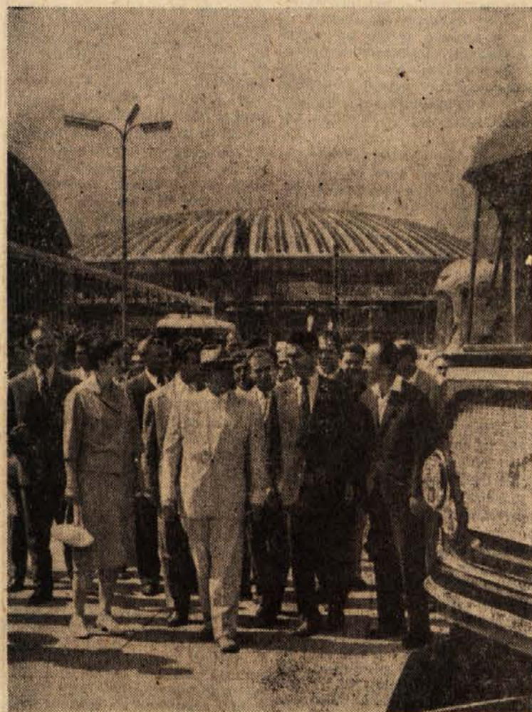
Predsednik Tito s spremstvom na beograjskem sejmju