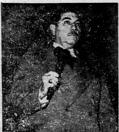
Dr. Luis Padilla Nervo, stalni zastopnik Mehike v OZN, je bil izvoljen za predsednika letošnjega zasedanja Generalne skupščine.

Na ozkem območnem pasu pri karauli Udvar se je že pred nekaj dnevi ustavil kamion madžarske vojske, takoj da imajo sedaj Madžari na tem delu meje dosti več vojaštva, kot ga je bilo prej. Madžarski obmojni stražniki streljajo večkrat na našo stran in so tokrat doli streljali tudi na našega gran-