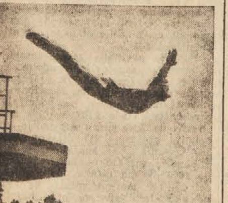
Skok mladince Dobrina s stolpa

Ljubljana, 6. avgusta. — Danes se je na Centralnem kopališču v Ljubljani pričelo prvenstvo Slovenije v skokih v vodo. Na prvenstvu sodelujejo tekmovalci-školanci iz Ljubljane, Bieda, Maribora in Kranja, ki so razdeljeni v tri kategorije: v začetni (kategorija C), v napredni, ki so že nastopali (kategorija B) in najboljši (kategorija A). Tekmuje se po novih pravilih.