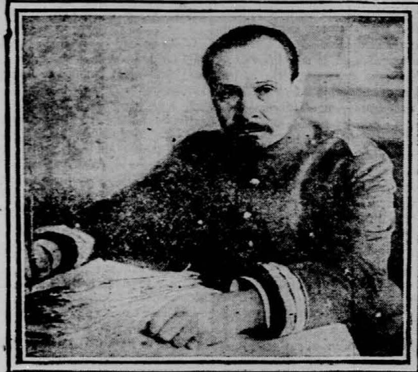
General Haller, poveljnik umikajočih se poljskih armad.