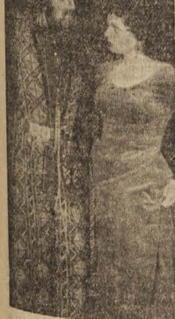
Prizor iz »Beneškega trgovca« v Hrvaškem narodnem gledališču

Povsod olje in krajine. Figurlike pa skoraj ni (izjema je monumentalno slikarstvo). In zakaj je ni? Nam manjka motivov, doživeti, mar je premočna tradicija slovenske krajine — slovenski temperament? Pa vendar smo imeli velike figurliste (Vesel, Strnen, Tratnik).