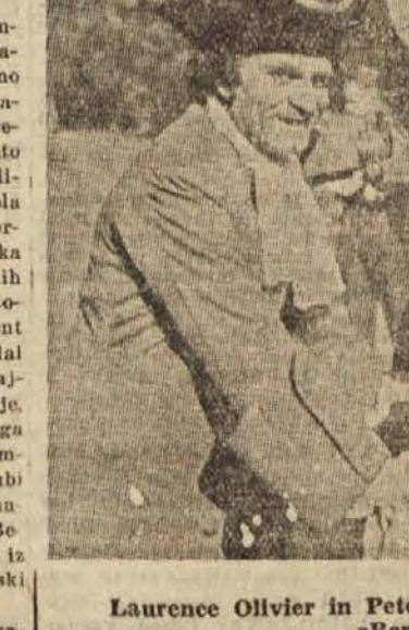
Laurence Olivier in Peter Brook med snemanjem filma »Beraška opera«