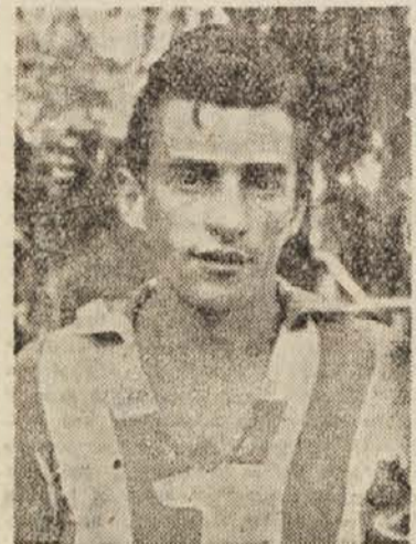
Belcer je dosegel prvi

Drugi polčas že v začetku ni razveselil navijačev Rabotničkoga. Belcer je v 52. min. izenačil iz solo akcije, v 61. min. pa je Toplak s prekrasnim udarcem prek presenečenega Vučinovskega dosegel drugi gol za svoje moštvo, nekaj minut kasneje, po nekaj razburljivih akcijah, pa je Rabotnički streljal faul nekaj metrov daleč od kazenskega prostora. Bačvarov je streljal mehko, spretni Dimitrovski je bil žogo dobil in jo med nogami več igralcev poslal v mrežo. Izenačenje ni vplivalo na nadaljnji tempo igre. Ljubljanci so ponovno prevzeli pobudo v svoje roke in igrali veliko bolje kot poprej. Obramba Rabotničkoga je imela polne roke. Za ne-nadno akcijo pa so si Skopljanci zagotovili zmago in dve točki. To se je pripetilo štiri minute pred koncem tekme. I. Z.