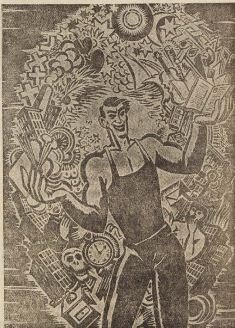
Franc Masereel (Belgija): Zongler