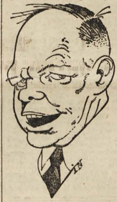
Dwight D. Eisenhower

v zunanjem ministrstvu, je sporočil, da so iz tega ministrstva odpustili 534 »za varnost nevarnih« uslužbencev. Samo po sebi