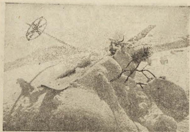
Zimsko tihožitje pod februarjskim soncem