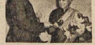
Rooseveltova in Panditova

Washington, 28. febr. (AFP). — Gospa Rooseveltova je sinoči izjavila, da senator McCarthy »širi strah po državi« in zato v tem trenutku pomeni »najhušo nevarnost« za ZDA.