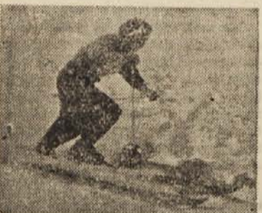
Zupančičeva je spet zmagala

Ekipa: Enotnost I. 5:56,4, 2. Lundenburz (Avstrija) 5:48,6, 3. Enotnost II. 5:50,8. Organizacija tekmovalja je bila dobra.