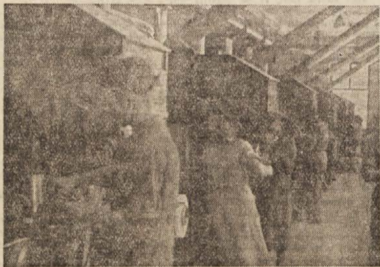
V ljubljanski tobačni tovarni