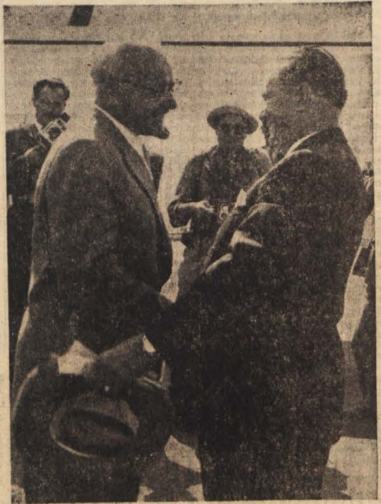
Prvi pozdrav voditelju poljskega naroda Gomulki

Gostoljubni Beograd je sprejel poljske goste in predsednika Tita takoj po odhodu z letališča s pozdravi vzdolž vse poti. Danes je bilo na ulicah jugoslovanskega glavnega mesta nad 300.000 ljudi iz mesta in okolice. Obkraj širokega bulvara, ki se začne blizu letališča, pa vse do novega mostu čez Savo, so delegacijo pozdravljali prebivalci Novega Beograda, študentskega mesta, bližnje vasi Bežanije in Zemuna, delavci tovarne kmetijskih strojev »Zmaj« in dijaki zemunskih šol. Na tisoče poljskih in jugoslovanskih zastavic in neštevilni šopki cvetja so se dvigali v pozdrav gostom in predsedniku Titu. Pri novem mostu so avtomobili vozili izpod slavoloka, na katerem je v polj-