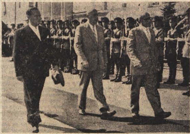
Wladislaw Gomulka in Juzef Cyrankiewicz pregledujeta v družbi predsednika Tita častni bataljon na zemunskem letališču

Med kosilom, na katerem je bilo okrog 110 povabljenih, sta predsednik republike Josip Broz Tito in prvi sekretar poljske Partije Wladislaw Gomulka izmenjala zdravici.