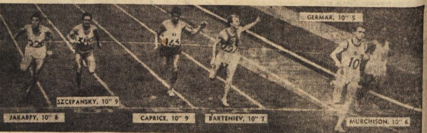
Vrstni red na cilju in časi tekačev v finalu na 100 metrov

Ze v prvem kolu je bilo nekaj zanimivih srečanj. V ponovljeni varianti španske partije je bila Trifunovičeva 18. poteza teoretična novost. Z žrtvijo kmetja je prišel Trifunović do aktivne igre figur, vendar je Bogdanović uspel izenačiti igro, nakar sta nasprotnika sklenila remi. Cioakaltea je v otvoritvi spregledal kmeta. Puc pa je slabo nadaljeval, tako da je njegov nasprotnik ob sklenitvi remija bil še celo v nekoliko boljšem položaju.