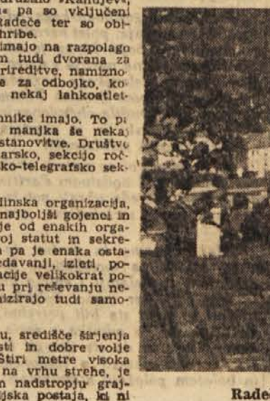
Radeče ob Savi. Poslopja VPD Radeče v desnem delu slike

Ko se zahvali za zaupanje močan, zagorel fant in objubi, da doma z mladicami ne bodo prekršili meja dostojnosti in počtenosti, mu molče pritrjuje dvajset parov oči, upravljenih s stiče, na katerih piše, da grejo na dopust — ker jim zaupajo... In ko potem skupaj zapojejo tisto priljubljeno »Lepo je v naši domovini biti mlad...«, vem, da bo vsak teh mladih ljudi našel v Domu tisti kosček sreče, za katero so ga opeharili, našel bo svojo resnično mladost — samega sebe. Tomaž Terček