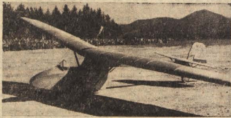
V nedeljo so v Slovenem Gradcu, kot smo že poročali, odprli novo letališče, ki je že enajsto v Sloveniji. Zgornja slika prikazuje jadrarno letalo pred startom, spodnja pa prelet štirih letal nad množico gledalcev na letališču. V spodnjem desnem kotu je moč videti kljun visokosopobnega jadrarnega letala »Košava«