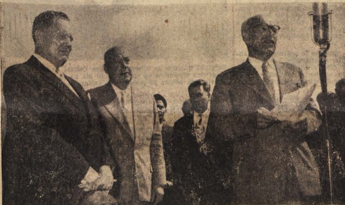
Predsednik Tito v družbi prijateljev Cyrankiewicza in Gomulke, ko slednji pozdravlja naše narode

Hladen zrak, ki je dosegel Srednjo Evropo, se nadalje umika proti severovzhodu. V Zahodno Evropo se dotekajo nove, nekoliko toplejše zračne mase.