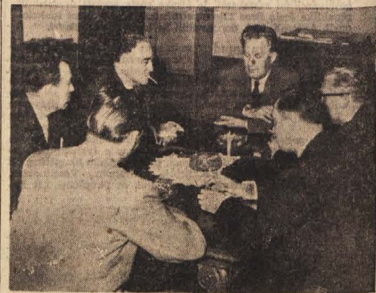
Belgijski minister za prosveto dr. Lea Collard in nekateri člani njegovega spremlja na sprejemu, ki mu ga je 9. t. m. priredil predsednik odbora za prosveto in kulturo Rodoljub Čolaković