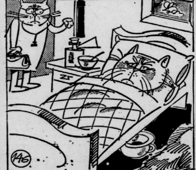
146. Miškomrzc je imel vedno manj pristašev. Veliko mačk je zbolelo. Tarnali so o bolečinah v trebuhu. »Kaj pa si jedel po travi?« — »Pri Človeku sem popil nekaj mleka.« — »Seveda, potem ni čudno, da te zvija.« se je jezil Miškomrzc. Mačkovo pa nikakor ni mogel prepričati, da bi jedli samo trave in nič drugega. Tu in tam se je zgodilo, da se je kdo že navadil na različne trave, potem pa je med travo po naključju naletel na miško. Lovska strast mu ni dala, da je ne bi ujel, želodec pa mu ni pustil, da je ne bi pojedel. Tako se je v hipu zopet spremenil v miškojeda, kar mu je bilo seveda všeč.