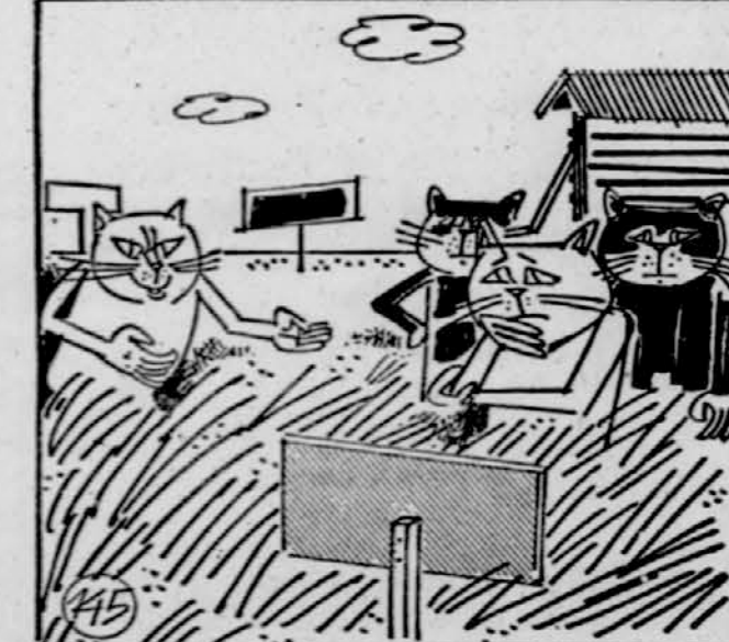
145. Poskusni center za uživanje trav je hitro zaživel. V njem se je vsak dan zbralo kakšnih dvajset trideset mačk, pač pa je bilo zelo malo med njimi. Strokovnjaki za trave Miškomrzc se jih je vodil po polju in jim razkazoval narazličnejše trave. Skoraj vsem travam je vedel imena, točno pa je tudi povedal, ali so užitne ali ne. Vsakdo je pokusil malo te, malo druge in zdelo se jim je, da trave pravzaprav res niso tako slabe. Le veliko jih je bilo treba porjesti, da se je napolnil prazen želodec. Tu in tam je koga ravno zaradi tega minilo potrpljenje. Ena miška je bila za vsakogar dovolj, tu pa je jedel travo pol dreva, pa je bil še vedno lačen.