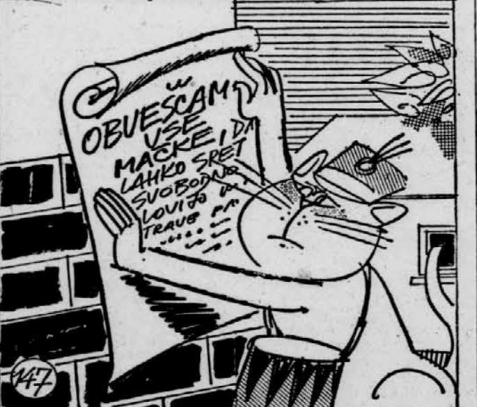
147. Zadeva o rastlinojedeh je prišla tako daleč, da sta morala posredovati župan in podžupan. Veliko mačkovo je zbolelo za drisko, veliko jih je oslabeo, poleg tega pa so miškam zrastle cene na črno na dvojnó, trojno vrednost. Zato je moral župan dati razglas: »Obveščamo mačke, da lahko svet slobodno loviho miške, trave pa naj jedo te tisti, ki ne čutijo po njih nobenih škodljivih posledic oziroma prebavnih motenj. Ne silij na se noben, ker to ni v interesu združenih dežel.« — »Pogoreli si so se sme-jali Miškomrzcju. »Kdaj pa do se imeli razumevanje za izumitelje!« je užaljeno odvrnil rastlinojedi maček in Putifarič.

VODORAVNO: 1. manjša gostilna, 6. italijanski karakterni filmski igralec (Paolo), 12. mesto v grški pokrajini Tesaliji, 14. slovensko podjetje za prodajo motornih goriv, 15. francoski pisatelj romunskega porekla (Pamati, 1894 do 1965), 17. pristaka sodobne slovenske filozofske in literarne smeri, ki temelji na filozofiji Martina Heideggerja in zavrača psihološko opisanje človeka, 18. začudneti jugoslovanskega izumitelja na področju elektrotehnike, 19. sodobni slovenski literarni teoretik in zgodovinar, docent na filozofski fakulteti v Ljubljani (Matjaž), 21. višinska točka na zemljevidih, 22. grška črka, 24. kronika, leto-pis, 26. avtomobilska označka (Reke, 27. avstrijski skladatelj, eden najbrédnejših skladateljev Schönbergova šole (Alban, 1865 do 1935), 29. zadnji predsednik republikanske Spanje (Miguel Ma-nuel), 31. latinska kratica za »prostozar za pečate« (olucos sigillo), 33. izdelovalec tekoče maščobe, 35. žensko ime, 37. oskrbnik vinskih zalog, 39. strokovnjak v vedi o gorovjih, 40. ptica pevka, 41. sta-rogipťovski pisatelj, ki je prvi zapisal povest o Jože-tu in Putifariču.