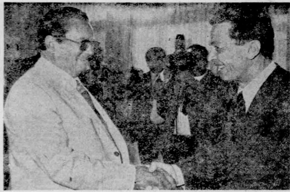
PRISRČNO SREČANJE V IGALU — Predsednik Tito in generalni sekretar KP Italije Enrico Berlinguer pred začetkom večeršnjih pogovorov.

(Zdravici s sinočnje večerje objavljamo na 5. strani.)