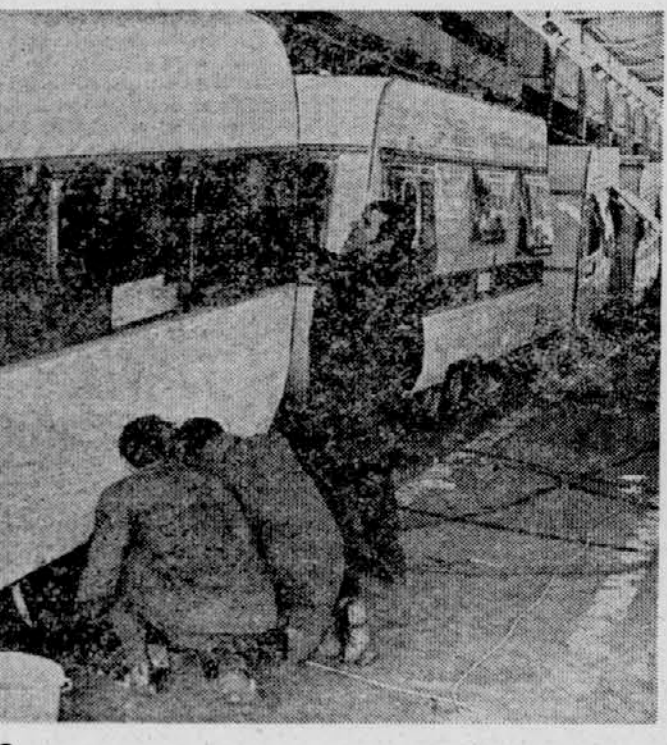
Vsak dan več prikolic NOVO MESTO, 10. oktobra — Tovarna IMV v Novem mestu se je po dolgoletnem trudu ustvarila med največje evropske proizvajalce poštinskih prikolic, odkar dela tudi njihova tovarna v Belgiji, pa se je proizvodnja povzpela na okroglih 100.000. Večina prikolic je prirejenih za različna področja, kot na primer posebno grejle za švedske kupce ipd. Pravo, da kljub konkurenci uspešno prodajajo.

dovolj denarja za takšne naloge, saj bi v tem primeru vsa dohodka ostajali doma. Slovenski predstavniki pa so postavili vprašanje, če so ti kovanci sploh priložnostni denar ali kaj drugega: iz osnutka zakona namreč ni razvidno, kakšna je njihova funkcija, saj plačilno sredstvo bržkone ne bodo. Ne nazadnje pa ne kaže pobud za kovanje takšnega denarja primerjati s kovanci, ki smo jih izdelali ob 25-letnici II. zasedanja AVNOJ, še posebno, ker bo tokar največ dela opravilo naše podjetje in so navedenega močne tudi razne spekulacije. Pomisliškov je torej precej. Ker jih nikakor ne gre pripisovati zgolj nejasnostim v svezi s pobudo organizatorjev sredozemskih iger v Splitu, bi kazalo o tej problematiki čimprej razmisliti s širšega vidika in jo kompleksno urediti s splošno uporabnim zakonom.