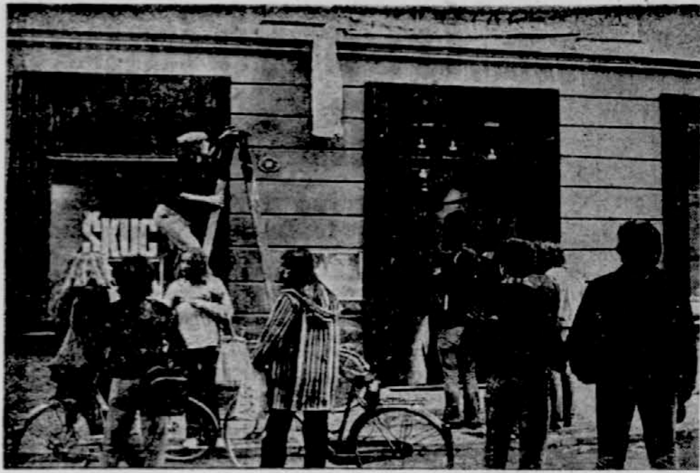
SKUCI POD NOVO STREHO — Novi prostori študentskega kulturnega centra na Starem trgu 21 so danes popoldne pritegnili pozornost večine ljubljanskih študentov.