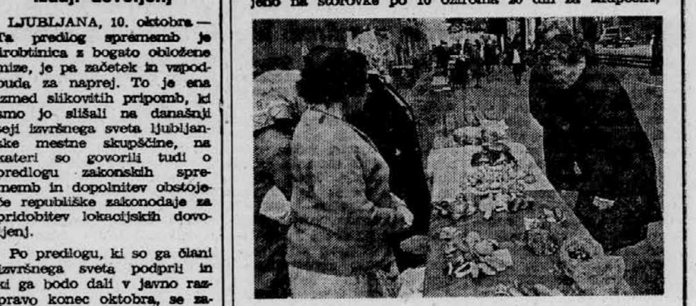
šampinjone, ki so 10 dinarjev dražji ter nekaj peščen, goblic in lisic. Jurčkov skoraj ni več — le tu pa tam ima katera od nakupovalk srečo in našli na osamljenega predstavnika pri nas najbolj priljubljene gobe. M. K.

Gebe grede - po gebe - Vse kaže, da gre gobja sezonsko proti koncu. Vse, kar je mogoče na ljubljanski tržnici kupiti, je omejeno na štorovke po 10 oziroma 20 din za skupščine.