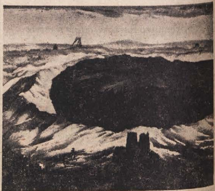
Meteorit, ki je leta 1908 padel v Sibiriji, je napravil žrelo s premerom 8 km, pragozd na področju 500 ha pa je popolnoma uničil. Če bi padel na Pariz, bi razdeljal središče francoskega glavnega mesta, kakor kaže tale fantazijska risba. — Na drugih krajih našega planeta so našli sledove meteoritov, ki so bili preveliki, da bi zgoreli zaradi trenja v zraku. Spričo tega je teoretično mogoče, da bi dovolj velik meteorit popolnoma razdeljal zemeljsko oblo