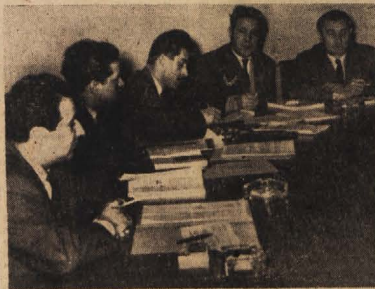
S seje odbora za organizacijo oblasti in uprave

Utrjevanje komunalnega sistema je tesno povezano z izgrajevanjem gospodarskega sistema; k povečanju produktivnosti dela, k izboljšanju življenjskega nivoja državljanov pa lahko mnogo prispeva skladno in učinkovito delo ljudskih odborov in njihovih organov ter organov delavskega in družbenega upravljanja v občini.