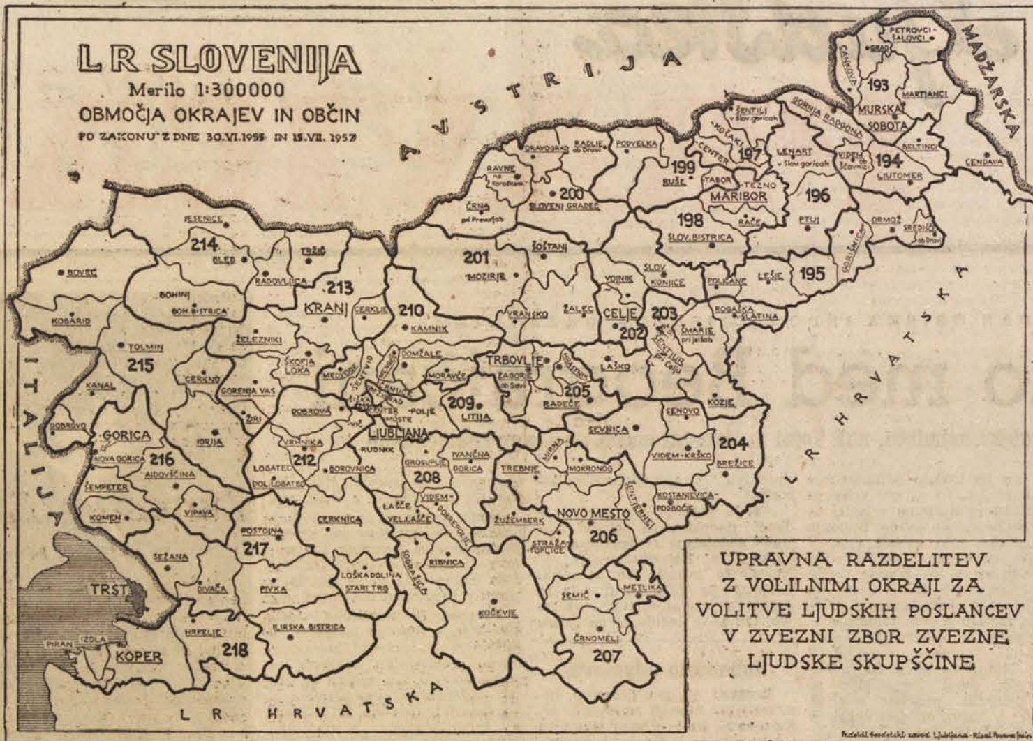
UPRAVNA RAZDELITEV Z VOLILNIMI OKRAJI ZA VOLITVE LJUDSKIH POSLANCEV V ZVEZNI ZBOR ZVEZNE LJUDSKE SKUPŠČINE

V vseh občinah Črne gore se razvija predvolilna dejavnost, v kateri sodelujejo vse politične in ostale družbene organizacije. V 23 občinah so že bili sestanki vodstev Socialistične zveze, Ljudske mladine, sindikatov, Združenja prosvetnih delavcev, ekonomistov in pravnikov, na katerih so proučili orientacijski načrt Glavnega odbora SZDL v predvolilni agitaciji in sestavili načrt predvolilne dejavnosti. Komisija za množične in družbene organizacije Glavnega odbora SZDL Črne gore je imela sestanek s predstavniki republikanskih vodstev družbenih organizacij, na katerem so sestavili načrt predvolilne dejavnosti. Sekretariat za zakonodajo Izvršnega sveta Črne gore je ustanovil posebno komisijo, ki potuje po republikah in pomaga občinam pri urejanju volilnih seznamov.