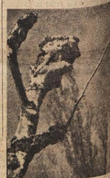
»Dirigent s taktirko v rokavi« je zapisal pod tale posnetek igre narave — oziroma vrtnarja — nekdo švicarski fotoamatör.

Za poskušnjo so že preselili nekaj levov na novo področje. Ko so smuknili iz kletk, so tako rjevali, da so se spremljevalci že bali, da bodo divji velikani pregnali iz pragozda vsu drugo divjad. V bližini so levom nastavili privezavo živo kozo in dvoje enoletnih telet. Po nekaj dneh so jih levi raztrgali, potem pa je bilo v pragozdu spet vse tiho. Spričo tega sodijo, da je prvi poskus uspel. Vlado funkcionarji so odločili, da bo treba počakati še leto dni, preden se bo začela velika selitev, pri kateri bodo sodelovala tudi vojaške enote.