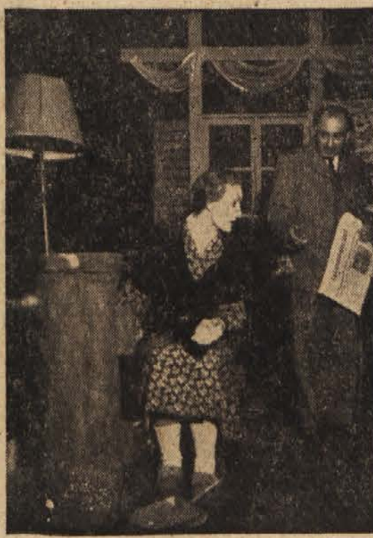
Obiski Slovenskega narodnega gledališča iz Trsta so v Ljubljani že tradicija in njegove predstave med najpriljubljenejšimi. Tržaški gostje so nas danes spet obiskali: drevi se bodo v Mestnem gledališču predstavili z izvirno domačo dramo Josipa Tavčarja »Priljubljeno nedeljo«. Isto delo bodo v naslednjih dneh dajali še šestkrat, nato se bodo vrnili domov in nas v februarju spet obiskali, ko bodo njihove predstave vključene v reden, abonmajski program

Pariz, 18. jan. (Reuter). Zunanji minister Christian Pineau se je danes vrnil iz Londona, kjer je bil en dan na zasebnem obisku ter se je razgovarjal z britanskim zunanjim ministrom Selwynom Lloydom. Oba ministra sta govorila o vseh vprašanjih, ki zanimajo obe deželi Ob prihodu v Pariz je Pineau izjavil, da morata Velika Britanija in Francija očitno zblizati svoja gledišča v nekaterih vprašanjih, kot na primer v zvezi z načrtom o evropski coni svobodne trgovine. Na splošno pa je Pineau zelo zadovoljen z londonskimi razgovori, čeprav njihov dnevni red ni bil pripravljen. Omenil je tudi, da sta s Selwynom Lloydom obširno razpravljala o bližnjevzhodnih vprašanjih.