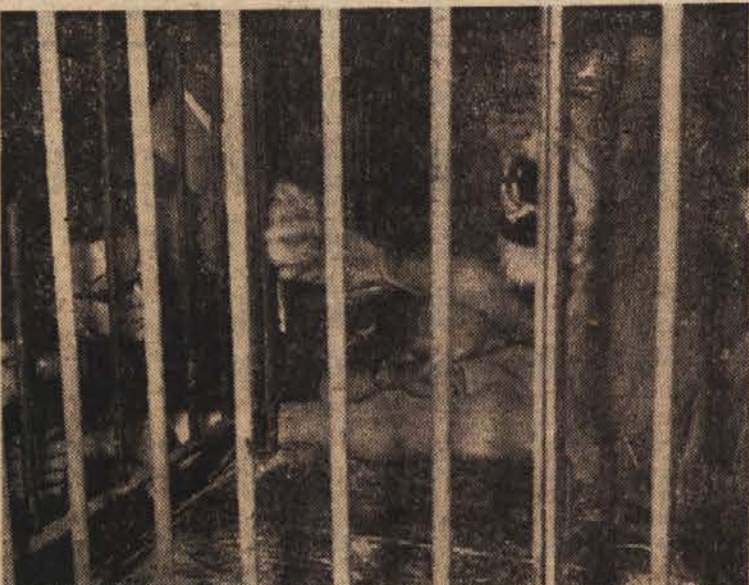
V Münchenskem cirkusu »Krone« sta se kar na lepem spopadla leva »Romeo« in »Achmed«. Romeo je morala po bitki priskočiti na pomoč zdravnica, ki je skozi rešetke takole opravila nevarno delo.

Francoska babica Leroy iz Guinesa blizu Calaisa je pred dnevi pomagala na svet novorojenčku z zaporedno številko 35.000. Zdjaj 66-letna babica je začela delati v tem poklicu leta 1912. Zanimivo pri otroku s številko 35.000 je to, da je ista babica pomagala na svet že novorojenčku stari materi, njegovemu očetu in materi ter njegovemu bratcu in sestrici.