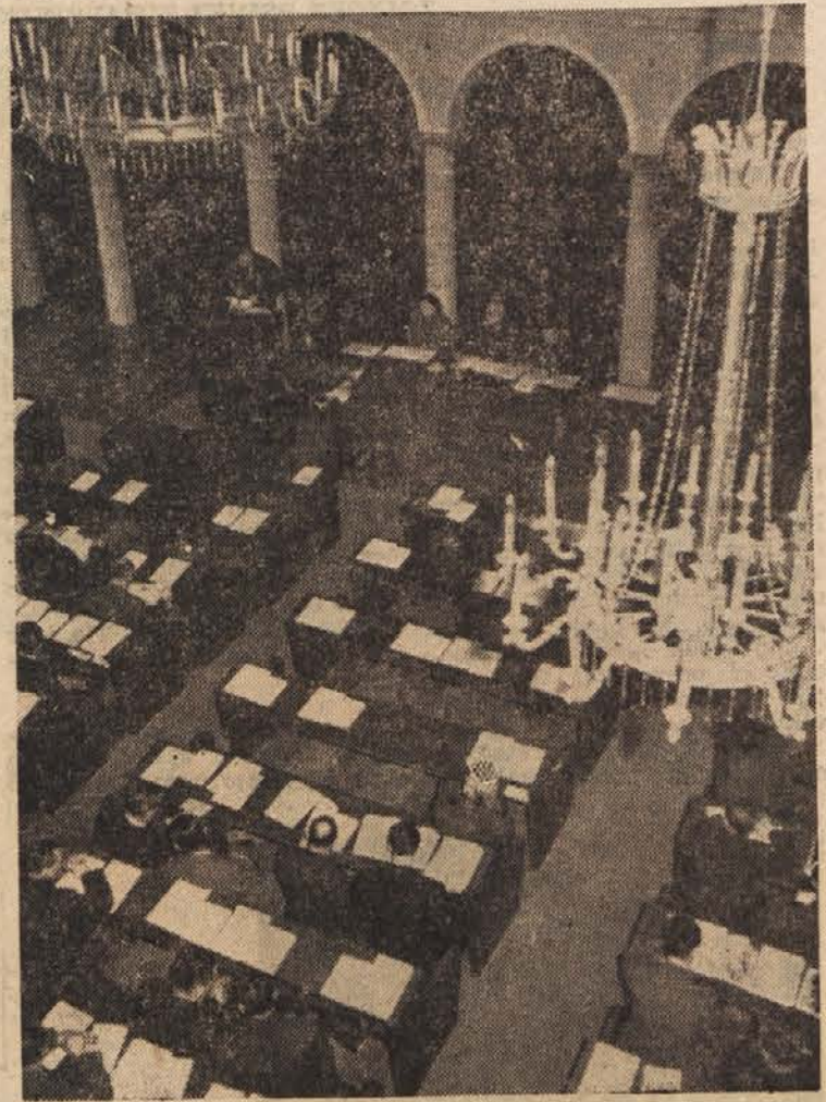
Pogled v Skupščinsko dvorano

To seveda še zdaleč ni vse in niti ni mnogo o preteklem delu naše skupščine. Vendar pa že iz povedanega vidite, da je opravljeno delo izredno obsežno in pomembno, čeprav je bilo opravljeno brez običajnega hrupa in prepira, ki je značilen za buržoazne parlamente, zato pa z mnogo večjo resnostjo in odgovornostjo pred volivci in našo socialistično prihodnostjo. Vsekakor bo nova Ljudska skupščina lahko gradila na solidnih in trdnih, že doslej postavljenih temeljih.