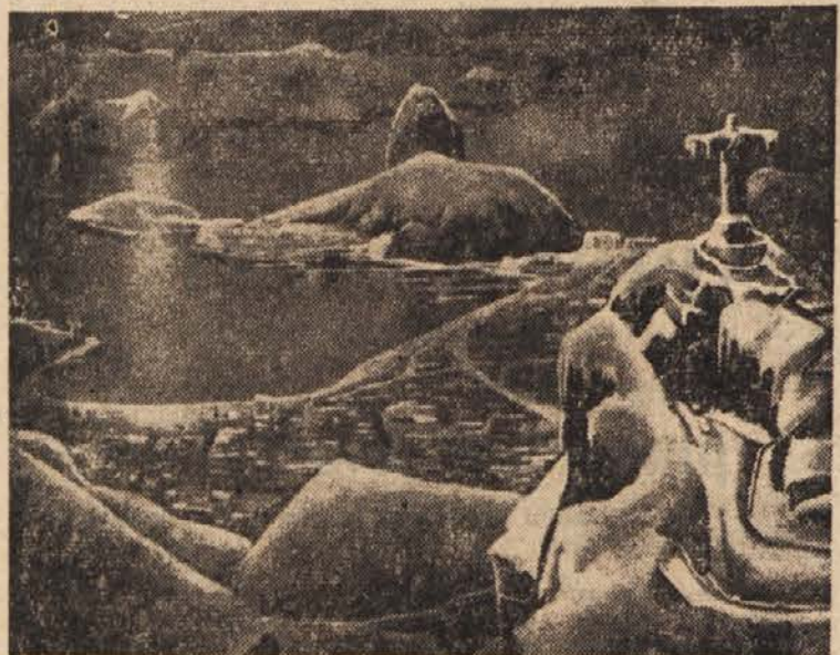
Sonce ima zalogo »goriva«, ki ga bo po matematičnih računih dovolj za deset milijard let, po tem neskončno dolgem obdobju pa bi se lahko ohladilo in ugasnilo, prav kot se je že zgodilo s številnimi drugimi zvezdami. Ta možnost, ki jo je opisal tudi že Wells v svojih utopijskih romanih, je dala pobudo risarju, ki je takole predstavil začetek ledene dobe v tropskem Rio de Janeiru