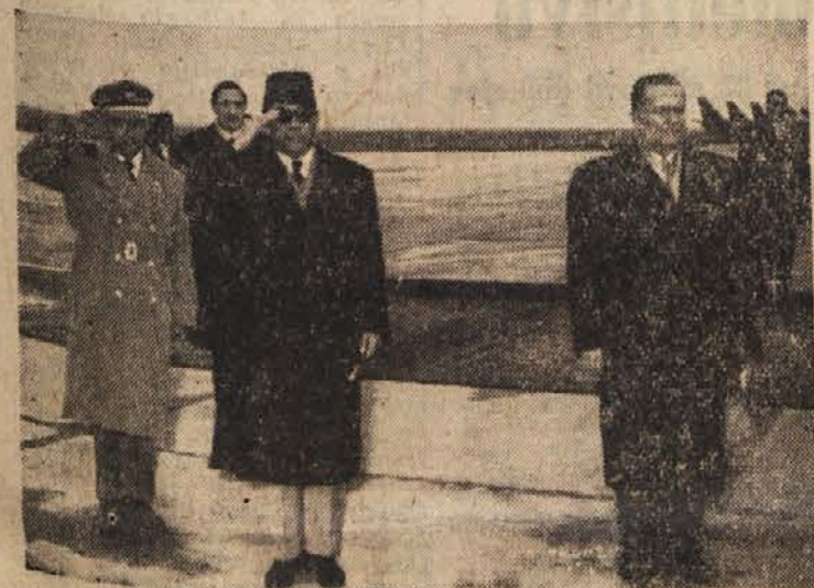
Predsednika Tito in Sukarno ob igranju državnih himen

Področje visokega zračnega pritiska nad Srednjo Evropo se razkrajja. Medtem ko se s severozahoda proti Srednji Evropi pomikajo nove frontalne mase, se ustvarja nad Sredozemjem slabotno področje nizkega zračnega pritiska.