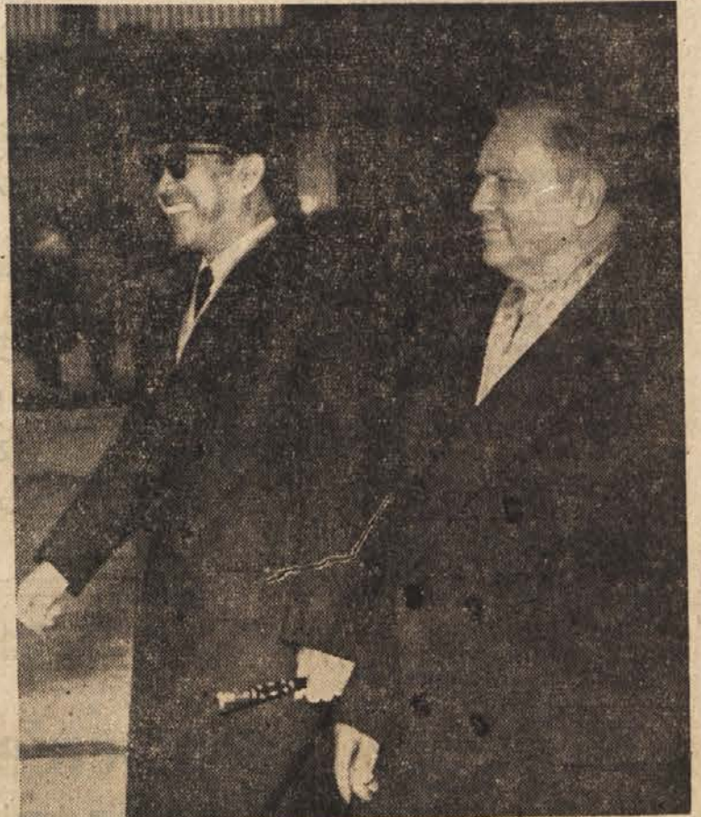
Ob odhodu z letališča v Zemunu