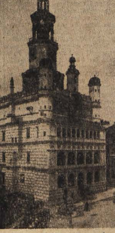
Obnovljena mestna hiša v Poznańu

Piloti zloglasne »Luftwaffe«, nacistični sejalci smrti iz jeklenih ptic s črnim križem, so tu počivali in se pripravljali na nove zločine, mi je pripovedoval mlad Poljak. Zdad je treba vse to očistiti in obnoviti, ohraniti bodočim rodomom še en dokument stare slave in veličine Poljske.