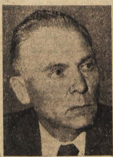
Pokojni madžarski zunanji minister Imre Horvath

Budimpešta, 3. febr. (Tanjug). V Budimpešti je sinoči umrl ma- džarski zunanji minister Imre Horvath. Imre Horvath se je rodil leta 1901. Od leta 1918 je bil član Komunistične partije Madžarske. Posle zunanjega ministrstva je prevzel leta 1956. Bil je odslej tudi član Centralnega komiteja Socialistične delavske partije.