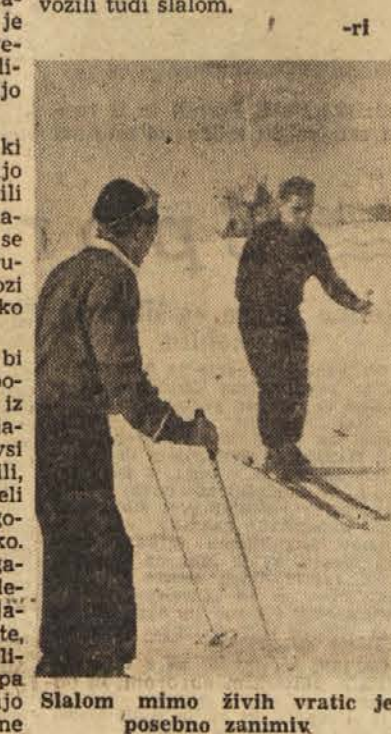
Slalom mimo živih vrat in posebno zanimiv

Nemčije in od drugod ter zahtevajo podrobnosti o tej »nezaslišani noviteti«. Ideja je pač že stara: Z dobro voljo in vztrajnostjo je mogoče marsikaj doseči, pa čeprav človek ne vidi. Kaj vse delajo slepi! In zakaj ne bi vozili tudi slalom.