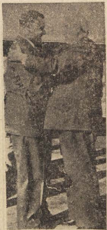
Gamal Abdel Naser in Sukri Kuatli

Tudi Aleksandrija je svečano proslavila združitve. Na glavnih križiščih so visele velike slike Naserja in Kuatlija in pod slavloloki so nenehoma hodile množice manifestantov ter vzklicale združitvi. Iz Gaze poročajo, da so šli včeraj vsi prebivalci tega mesta in okolice na ulice, da bi proslavili ustanovitev nove arabske republike.