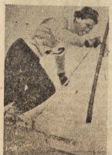
Avstrijka Putzi Frandl se je morala zadovoljiti z drugim mestom

Riga, 3. februarja. — Danes so na šahovskem prvenstvu SZ odigrali prekinjene partije: Furman-Suetin 0:1, Polugaevski-Korčoj, remi, Petrošjan-Furman 1:0, Gipsils-Averbach remi, Kotov-Tajmanov 0:1, Polugaevski-Kotov 1:0, Krogius-Toluš 1:0. Po XII. kolu vodi Spaski z 8 pred Petrošjanom 7,5, Averbachom in Boleslavskim po 7, Gellerjem 6,5 (1) itd.