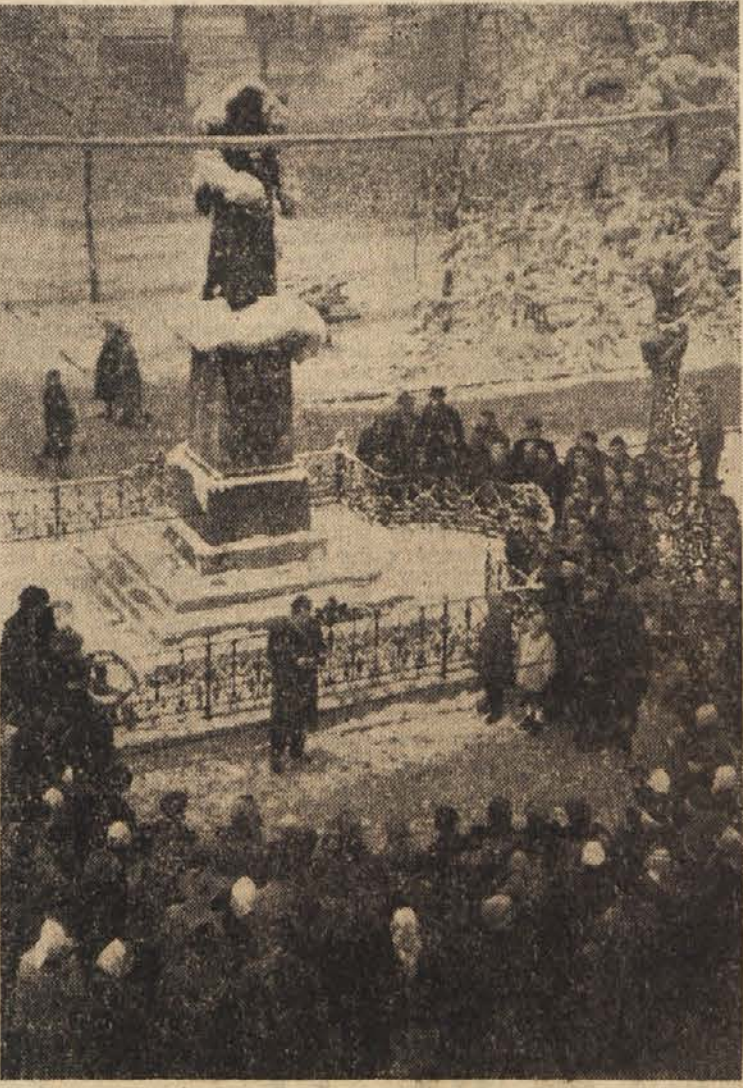
POČASTITEV 200-LETNICE ROJSTVA VALENTINA VODNIKA

je moč doseči sporazum o poletih v vesolje izključno v miroljubne namene s pogojem, da je prepoved medcelinskih balističnih raket del splošnega problema atomskega in vodikovega orožja. Ko so predstavnika oddelka za tisk v zunanjem ministrstvu Ilji- čeva vprašali, ali so bila podobna pisma poslana tudi predsednikom vlad ostalih zahodnih držav, je odgovoril, da mu je znan samo od- govor predsedniku Eisenhowerju. Na vprašanje, katere dežele naj bi po mnenju sovjetske vlade sode- lovale na sestanku najvišjih predstavnikov, je Iljičev odgovoril, da pridejo v poštev državniški so- cialistični in zahodni deželi.