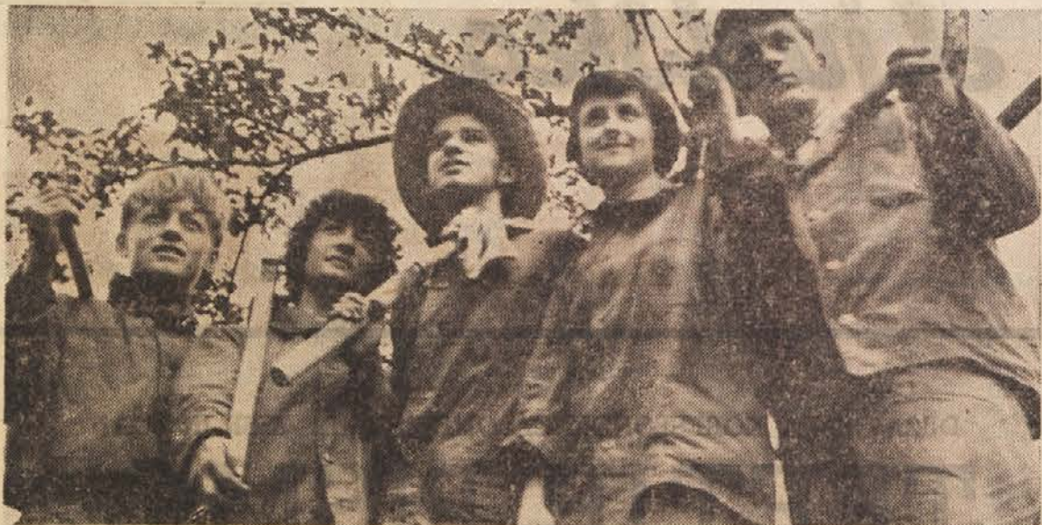
Sklep o veliki mladinski delovni akciji, to je o gradnji avtomobilske ceste »Bratstvo — enotnost« Zagreb—Ljubljana je sprožil v Sloveniji veliko zanimanje. Iz mnogih krajev prihajajo številne prijave za udeležbo pri graditvi. Med drugimi sta se doslej prijavi tudi Višja gospodinjstva šola v Grobljah in Višja šola za medicinske sestre v Ljubljani. Le-ti bosta poslali v mladinske brigade svoje slušateljce, ki bodo organizirale prehrano in sanitetno službo brigad. Prvih sedem sto mladincev iz LRS bo odšlo na delo že 1. marca; pripravljali bodo bivališča, gradili športne in druge objekte, ki bodo za kulturno in športno razvedrilo mladine.

V zvezi z volilno kampanjo pa je treba reči še to, da če bomo vse te analize imeli izdelane in če bomo konkretno razpravljali o teh problemih, potem bo naša predvolilna kampanja lahko zelo pestra. Izredno pomembno se mi zdi, da bodo naši kandidati za poslance šli ne samo na zborovnice in velika predvolilna zborovanja, ampak bi bilo prav, če bi stopili v stike tudi z ljudmi, ki delajo na posameznih področjih družbene skrbi za človeka, se pravi s tovariši, ki delajo na primer v potrošniških svetih in stanovanjskih skupnostih, ter z njimi vsa ta vprašanja preanalizirali. Prav tako pa je potrebno, da pridejo v neposreden stik s predstavniki delavskih svetov in sindikalnih organizacij v podjetjih.