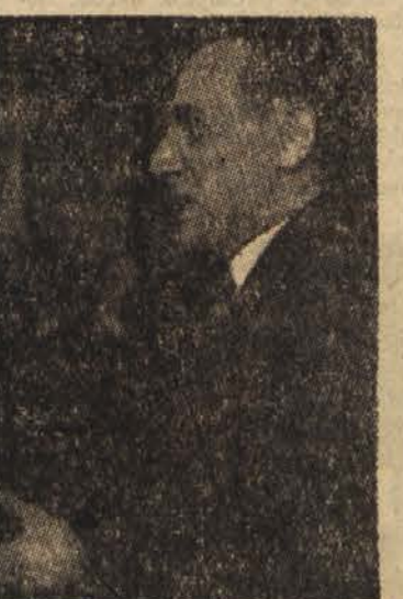
Enrico Mattei, direktor italijanskega državnega podjetja za nafto ENI

Predsednik nizozemske vlade Dries je danes po podpisu sporazuma izjavil, da se dežele Beneluxa dosegle visoko stopnjo ekonomskega sodelovanja ter težijo zdaj h konkretnemu cilju, da bi čimbolj izpopolnile tudi skupni trg. Luksemburški ministrski predsednik Beck je dejal, da so te dežele ustanovile skupni trg na podlagi pridobljenih izkušenj, medtem ko so ostale evropske dežele šele na začetku te poti. Belgijski ministrski predsednik Van Aker pa je poudaril, da si dežele Beneluxa prizadevajo, da bi docela vskladile svoje trgovinske sporazume, svobodni trgovinski promet in tudi svojo kmetijsko politiko.