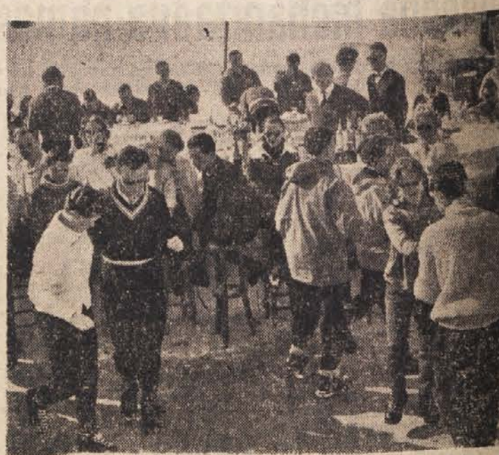
Turisti v Badgasteinu se smučajo pa tudi plešejo

Jutri je prost dan, v sredo pa se tekmovanja nadaljujejo. Slavko Fras