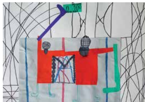
Tabela 7: Možnosti medpredmetnega načrtovanja v četrtem razredu in primeri likovnih nalog