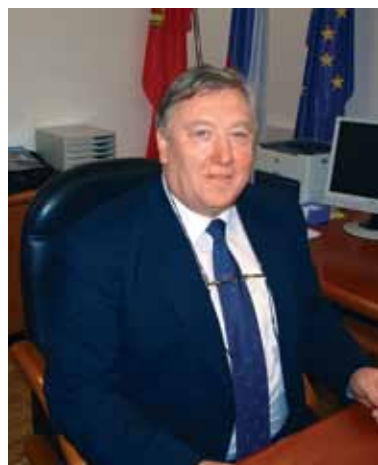
Spoštovane občanke, spoštovani občani!

D ve preprosti, a plemeniti besedi, prosim in hvala, imata veliko težo. Sta izraz spoštovanja, vljudnosti in topline. Težko ju je opisati, velikokrat še težje izreči. In vendar izražata osnovni odnos do sočloveka. Žal živimo v času, polnem nestrpnosti, negodovanja ter neodgovornih ravnanj, na besedi prosim in hvala pa smo že skoraj pozabili. Ujeti smo v začaranem krogu, polnem želja, in se ne zavedamo, da smo za njihovo uresničenje odgovorni sami. Narediti moramo številne majhne korake za dosego cilja, pri tem pa paziti, da s svojimi ravnanji ne prizadenemo soljudi in narave, ki bo le neokrnjena lahko služila našim zanamcem.