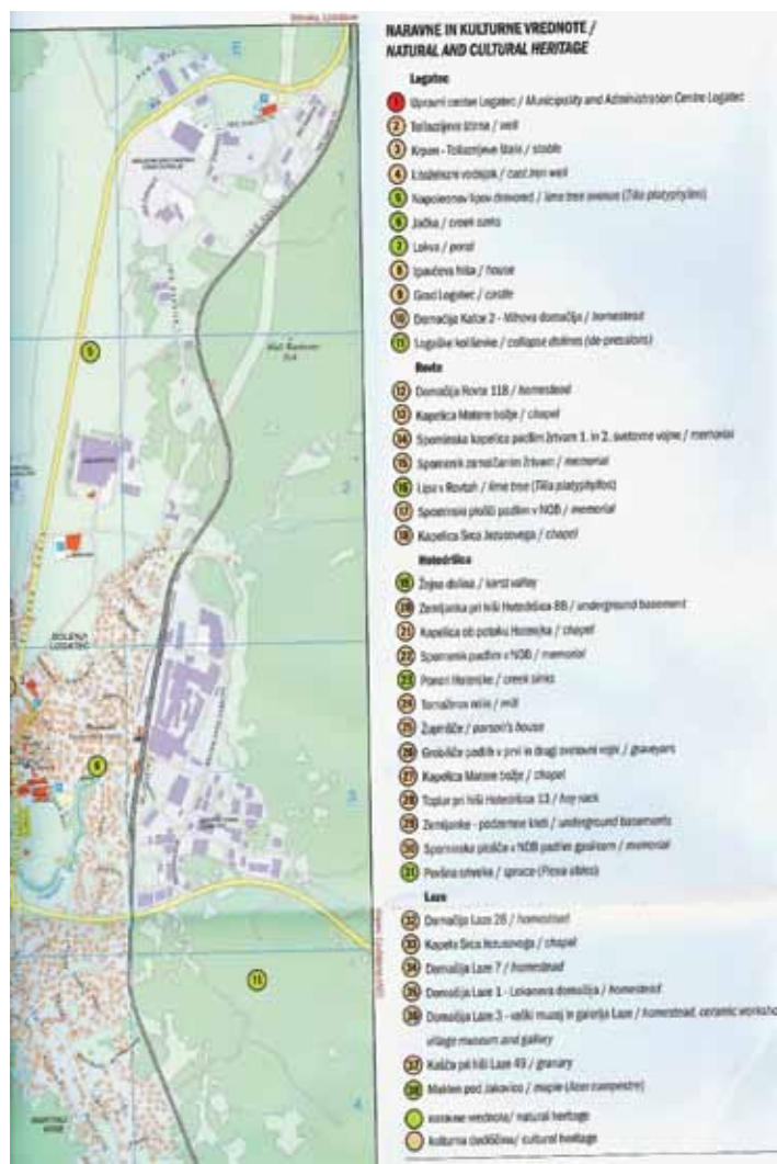
Zemljevid logaške občine z naravno in kulturno dediščino.