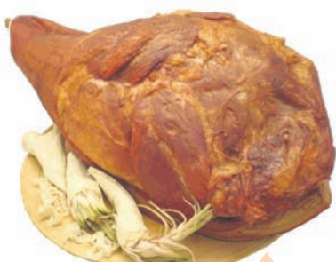
PREKAJENO PLEČE s kostjo in kožo