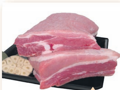
SVINJSKA REBRA brez kože