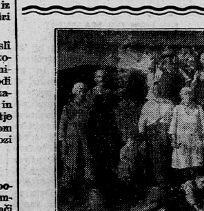
V trškogorskih vinogradih, prizadetih po hudi toči preteklega ponedeljka, morajo opraviti zasilno trgatvo.

Slovenske gorice, cerkvice in hramki; viharji so šli preko vaših pobočij, svetle noči so strmele na vas. Ti zemlja pa ležiš negibno in porajaš iz sebe rodove in cvetje in topole segajoče v nebo. Ali so res tvoji ljudje tako polni strasti in otroštva in vina in tišine goric, ki jih med gaji po-