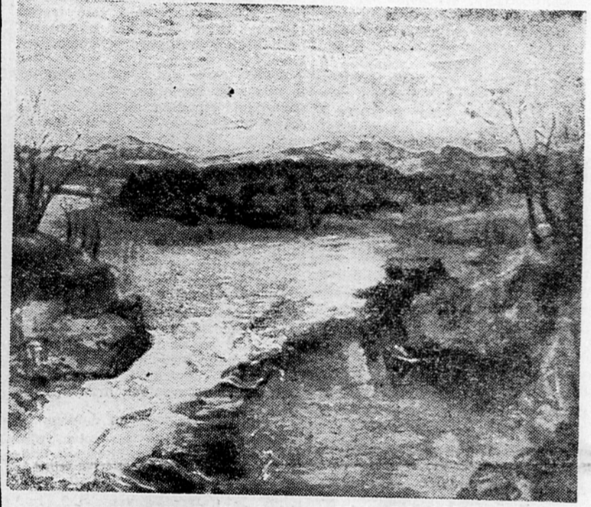
Fran. Pavlovec: Sava pri Medvodah (olje)