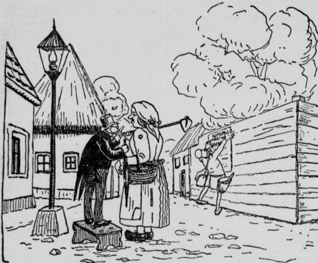
Sijajen shod liberalne stranke na Kureščku.