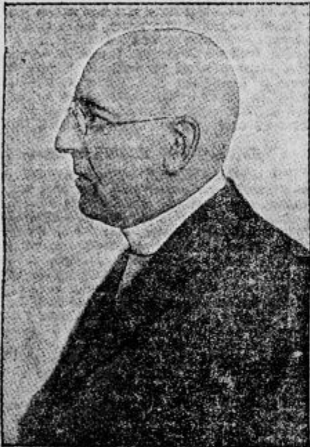
Avstrijski zvezni kancler Seipl, ki je bil napaden in je sedaj ozdravel.