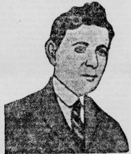
Dumini, morilec poslanca Matcootija.