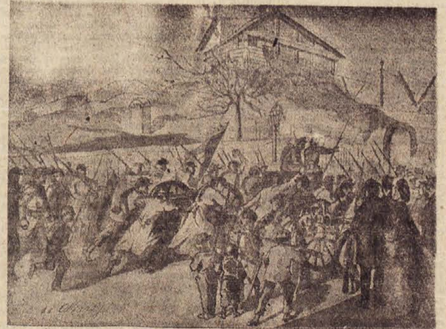
Naskok na grič Montmartre v Parizu, kjer so se pariški revolucionarji l. 1871 polastili znamenitih topov in kjer so prvič v zgodovini človeštva postavili revolucionarno proletarsko oblast.