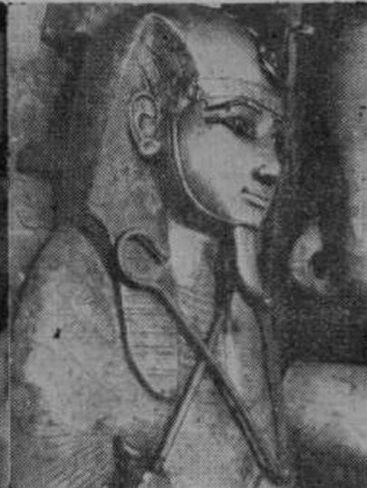
Srebrna krsta faraona Psusennesa, ki je bil tast kralja Salomona in je živel okrog leta 1000. pred Kr. r.