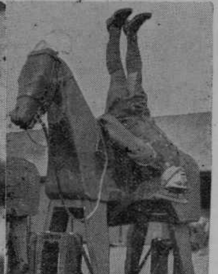
Takole vežbajo angleške konjeniške regrute, da bi jih vsestransko usposobili za vojaško službo

ji, da jo lepo pozdravim. Pa molita v nebesih za mamo in za atka tudi, kajne, Tonček!»