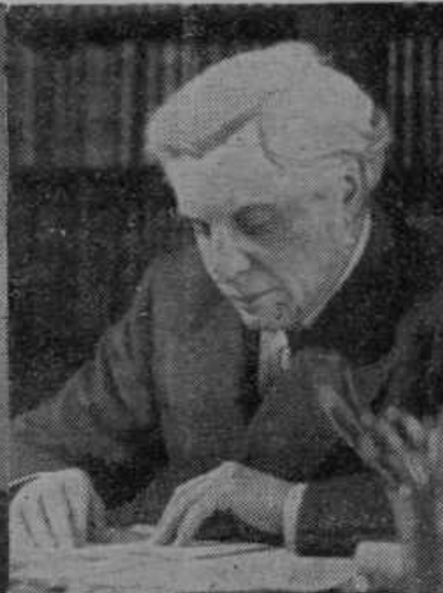
Znani francoski politik Paul Boncour je bil od francoske vlade poslan v važni službi na Vzhod