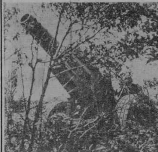
Težki nemški možnar v položaju na francoski obali, ki bo streljal ob pričetku nemške ofenzive čez morje v Anglijo

Dalje je vse srednje topništvo osredotočeno na sever, na zemeljsko progo. Sicer so pa ti srednji topovi zastarani. Vendar so to baterije, ki so vzdane v skalo, dasi v starokopitne galerije. Brez dvoma so Angleži storili vse, da so že dane težkoče za napadalca na vse mogoče načine še povečali.