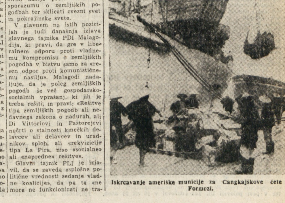
Iskrcavanje ameriške municije za Cankajskove čete na Formozi.

obveznost politike socialnih reform. Resolucija ACLI poudarja tudi azaskrbljenost vzbujajočo zaostrite stališča sil gospodarske desnice, ki si poskušajo pridobiti vedno večji vpliv na življenje v deželi. Na drugi strani pa je veleposnestična «Confagricoltura» danes izdala izjavo, ki zavrača vladni sporazum o agrarnih pogodbah, o katerem pravi, da «skri pravico do zasebne lastnine, ki jo slovesno jamči ustanova». Confagricoltura seveda dodaja, da bo nova ureditev zemljiških pogodb škodovala kmetijski proizvodnji. Obenem je združenje veleposnestnikov sklenilo izvesti obirno akcijo proti vladnemu sporazumu o zemljiških pogodbah ter sklicati zvezi svet in pokrajinske svete. V glavnem na istih pozicijah je tudi današnja izjava glavnega tajnika PDI Malagodijskega, ki pravi, da gre v liberalnem odporu proti vladnemu kompromisu o zemljiških pogodbah v bistvu samo za stesen odpor proti komunističnemu nasilju. Malagodijski naddaljuje, da je poleg zemljiških pogodb še več gospodarsko-socialnih vprašanj, ki jih je treba rešiti, in pravi: »Rešitve tipa zemljiških pogodb ali nedavnega zakona o nadurah, ali Di Vittoriovi in Pastorevi načrti o stalnosti kmečkih delavcev ali delavcev in uradnikov sploh, ali arekvizicije tipa La Pira, niso «socialne ali enaprredne rešitve». Glavni tajnik PLI je izjavil, da se zaveda «splošne politične vrednosti sedanje vladne koalicije, da pa ta ena more ne funkcionirati ne tra-