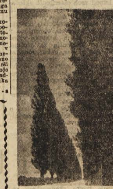
Topolov drevored ob cesti Murska Sobota — Rakičan

Sindikatski državni uslužbenec v Ljutomeru je bil sestaneč, na katerem so člani sindikata razpravljali o različnih vprašanjih. Posebno ostro so obsojili nekatere nepravilnosti glede discipline. Mnogo je bilo govora tudi o bodočih nalogah sindikata. Na sestanku so sklenili, da bodo organizirali seminarje, na katerih se bodo člani sindikata seznanjali s različnimi novimi predpisi.