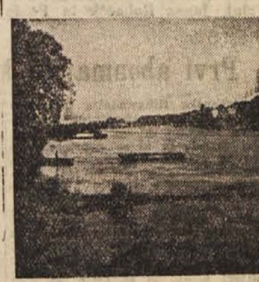
Večer ob Dravi

Sredstva, ki jih je prejel črnomojski okraj kot pomoč, skrbno izkoriščajo po predvidenem načrtu. Posebno vesel so belokranjski ljudje vodovod, ki jih gradijo v mnogih krajih Bele krajine, v Jernej vasi in Dobličih ter mnogih okoliških vseh po Doblički gori.