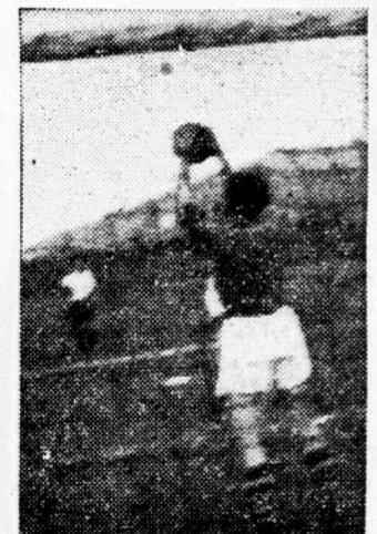
Uspela akcija vratarja Razbornika