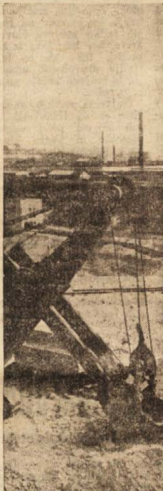
Dnevni kov v borskem rudniku