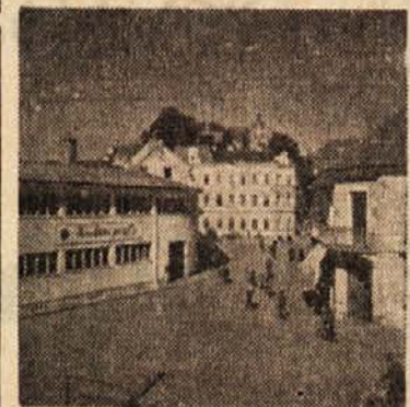
Ptuj, pogled proti okrajnemu ljudskemu odboru

Devet mladincev in sedem mladink, članov Kluba za konjski šport v Ptuj, pridno trenira, ker se pri-