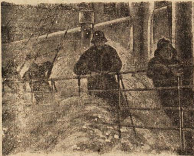
Ladja se bori s silnim viharjem na morju

Strokovnjaki računajo, da je blizu škotske obale in Hebridskih otokov kakih 10 milijonov ton morske trave. Če bodo našli še novo komercialno uporabo za to novo surovino, bo postala industrija alg v škotskem gospodarstvu važen činitelj. Zato inštitut za proučevanje morskih alg ob denarni pomoči Škotskega fonda za razvoj proučuje nadaljnji razvoj in učinkovitejše metode nabiranja morske trave. Delo inštituta zajema tudi druge kemikalije, ki so jih našli v algah in ki bi jih lahko komercialno izkoriščali. Dve izmed njih bi lahko uporabljali v industriji kozmetičnih preparatov in razstreliv. Iz morske trave pridobljeno manitol, sladkorju podobna snov, je šele v začetni fazi razvoja in zdaj v mnogih znanstvenih ustanovah proučujejo njegove lastnosti, da bi ugotovili, ali ga bodo lahko uporabljali v industrijske namene.