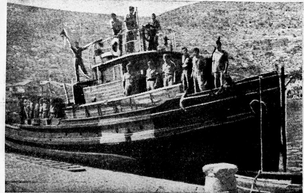
Ena izmed naših slavni oboroženih ladij v narodnoosvobodilni borbi na Jadranu