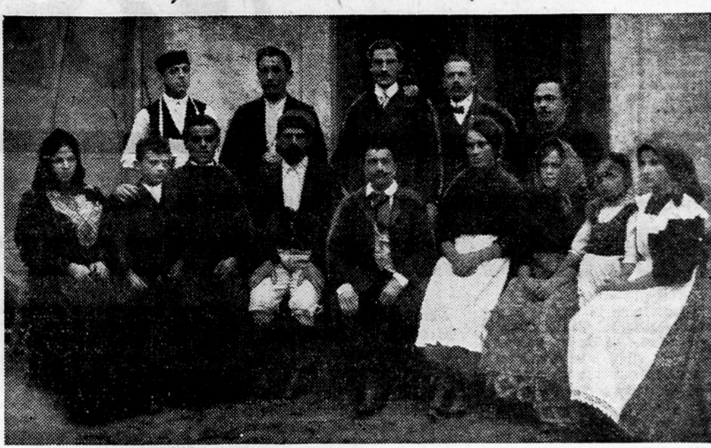
Minar in njegova hčra na hrastniškem delavskem odru leta 1913