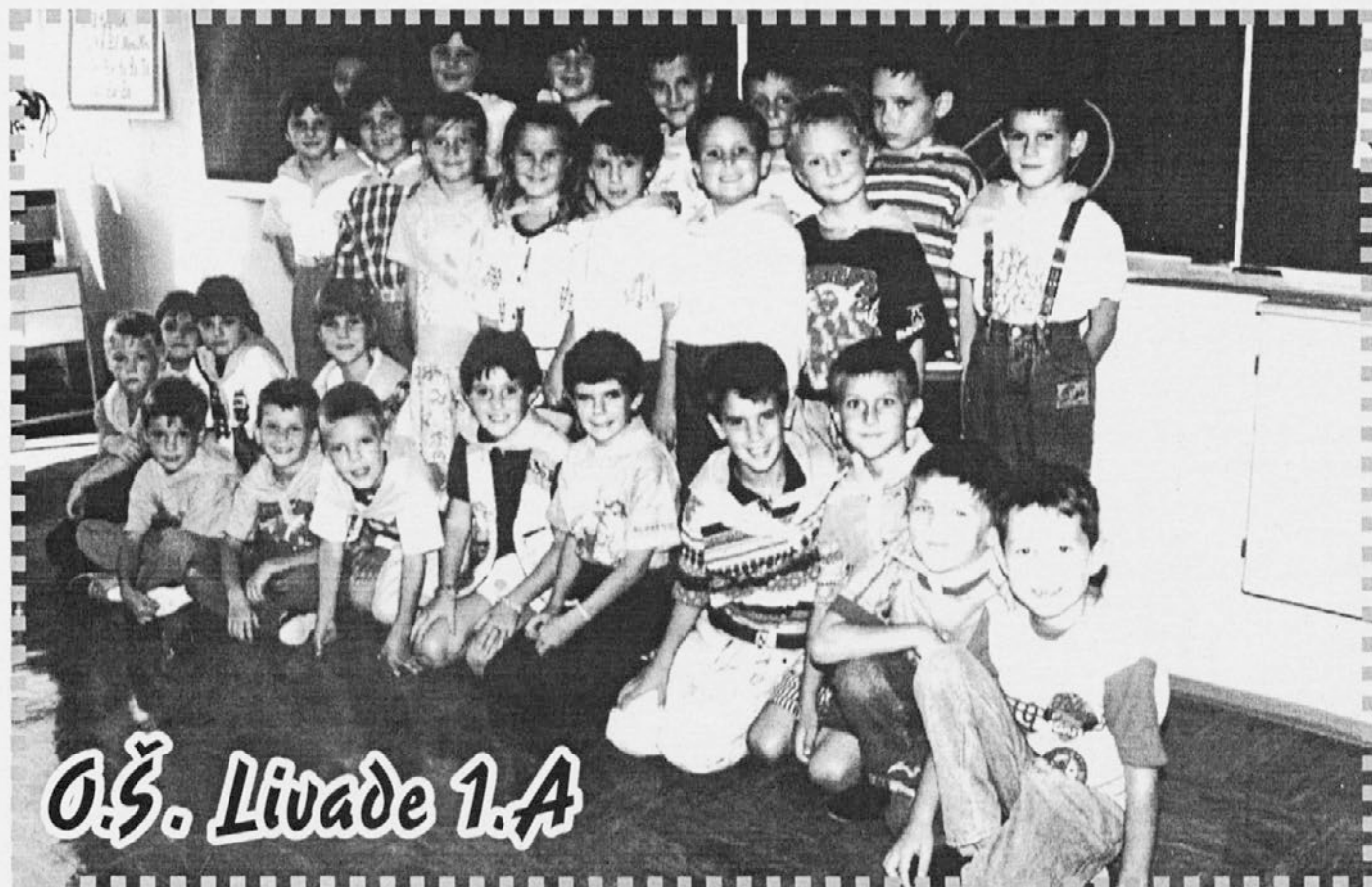
O.Š. Litvade 1.A