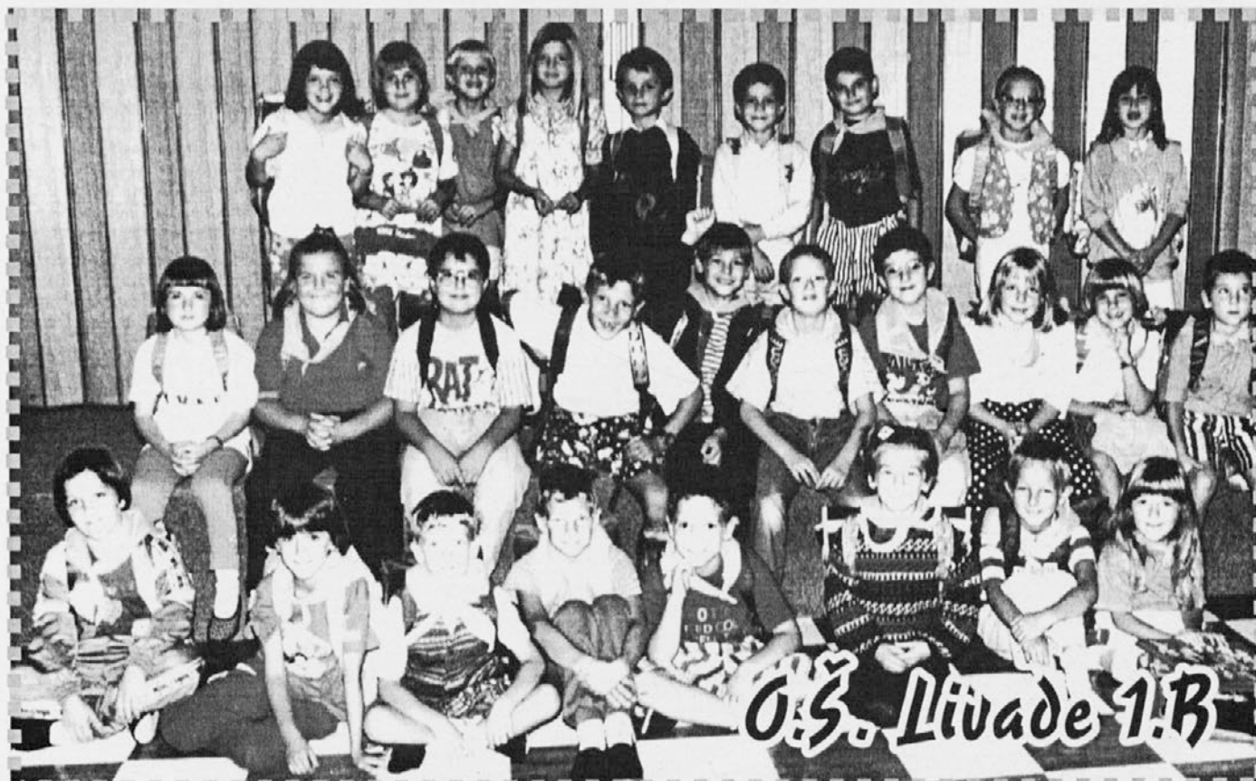
O.Š. Litvade 1.B