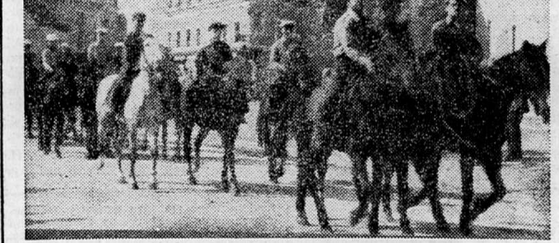
Mimohod članov ob dnevu konjskega športa v Postojni

Začela so se tekmovalna zvezna lige v hokeju na travi. V prvi tekmi v Zagrebu je prevladala »Jedinstvo« premagal predstavništvo Slovenije »Gradis« iz Ljubljane s 6:0.