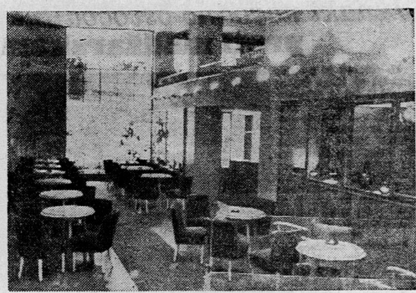
Nov reprezentativni lokal v Ljubljani. Minuli teden so v prostorih ljubljanskega hotela »Slona« odprli okusno urejeno slaščiarno. Obiskovalci hvalijo lepo urejeni prostor, zadovoljni so s postrežbo, ne odobravajo pa previsokih cen.