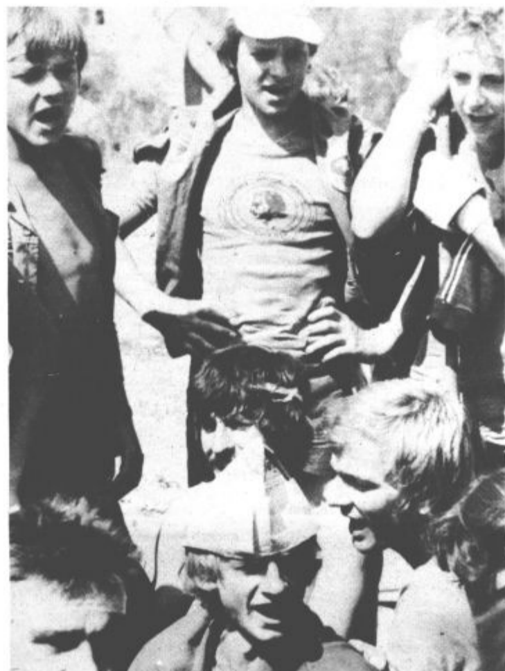
Brez pesmi pa ne gre