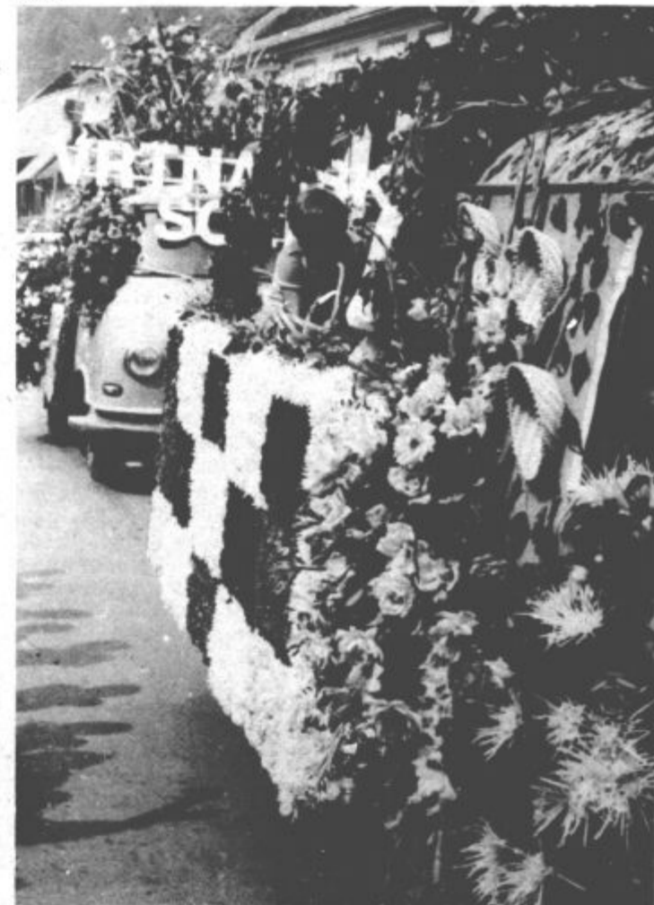
Hortikultura 78 v Mozirju – neponovljiva lepota barv, cvetja in spretnosti vrtnarskih rok

oletnih mmesecih, spričo ugodnih hidroloških prilik, ponavadi ni večjih potreb po električni energiji termoelektrarn. Tako je tudi letos. Sicer pa poletne mesece vsako leto izkoristijo v šoštanjskih termoelektrarnah za remonte. Letos so tako v Šoštanju opravljali remont prvih treh blokov. Trimejni remont prvega in drugega bloka so uspešno zaključili že 15. julija, vendar pa zaradi kasnitve konstrukcije elektrofiltrov nista bila takoj usposobljena tudi za redno obratovanje. Do zamude je to zaradi nepravočasnih dobav elektroopreme za filtre iz Švice. Remont na tretjem bloku pa še ni. Turbino so v Karlovcu že popravili, delo pa bo končano sredi septembra, ob koncu septembra pa 1. faza šoštanjskih termoelektrarn, moči 75 MW, pripravljena za proizvodnjo električne energije. Ukvarajo se tudi s projektiranjem zaščito oziroma izboljšanje človekovega okolja so se v šoštanjskih termoelektrarnah pričeli, da ob letošnjih remontih, rekonstruirajo tudi elektrofiltre prvih treh blokov. Stari, ki so bili dotrajani, so izločali 97 % pepela, novi pa ga bodo kar 99,9 %. (M)