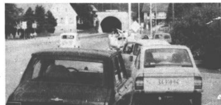
Mnogi so bili v ponedeljek neprijetno presenečeni, ker so jih zaradi neprimerne hitrosti ustavili in kaznovali miličniki