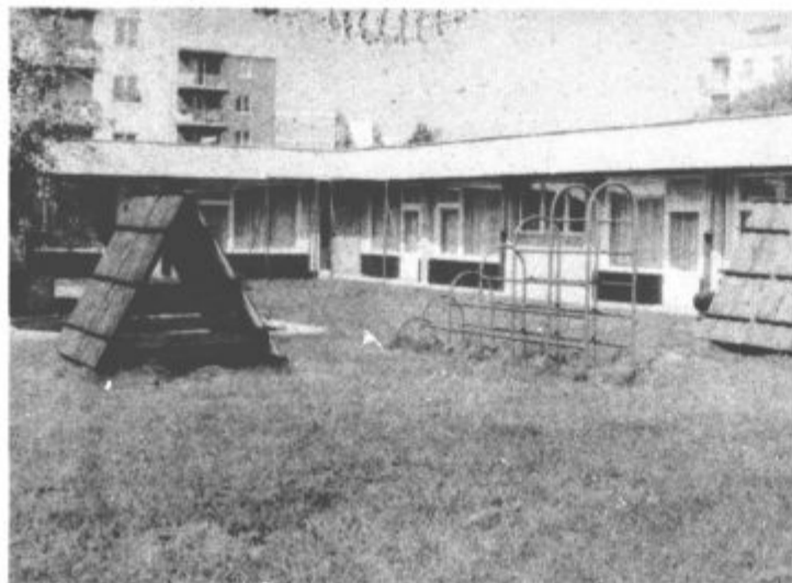
Preko šolskih počitnic so uredili vse otroške vrtece

Vse to pa je povezano s precejšnjimi stroški, saj je moral zavod nabaviti dodatne didaktične materiale. Tudi v letošnjem šolskem letu bodo otroci tekmovali za športno značko. Letos bodo prišli v konec tekmovanja in tisti, ki so se že naučili smučati, plavati, kotalkati,