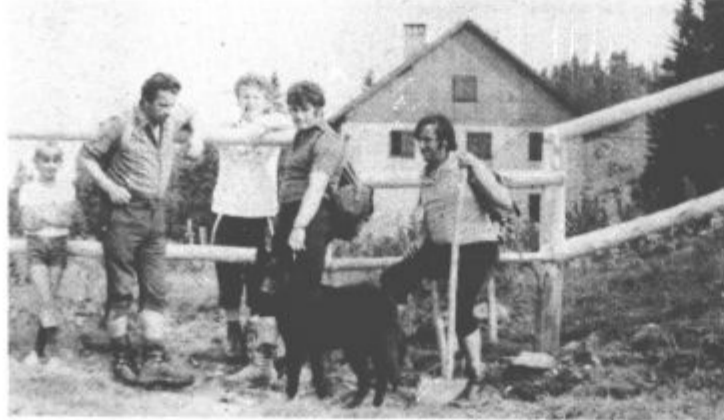
Gornjegradske planince pred začetkom ene od prostovoljnih delovnih akcij

pred prvo svetovno vojno in sicer na Loki pod Raduho. Po končani prvi vojni je savinjska podružnica sprejela v svoje okrilje tudi vse dotodanje nemške kočice, med njimi tudi kočico na Korošici in Piskernikovo zavetišče v Logarski dolini.