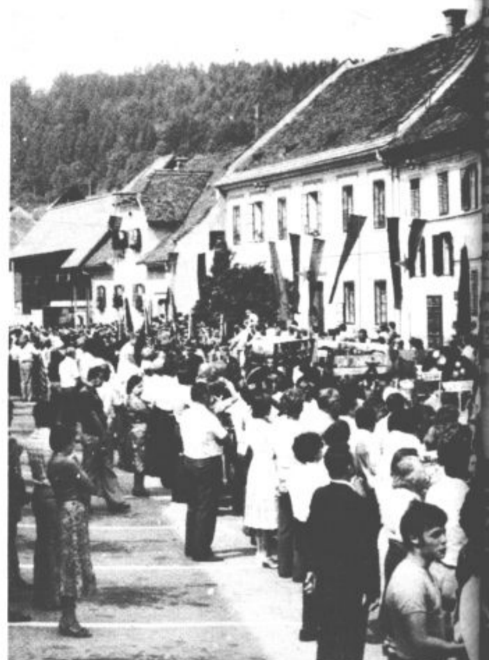
Nedeljsko povorko cvetja v Mozirju si je ogledalo na tisoče ljubiteljev cvetja