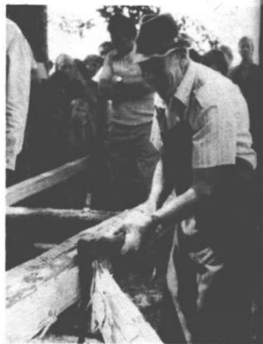
Obiskovalci so si ogledali tudi, kako so si pomembni včasih ko še ni bilo žag