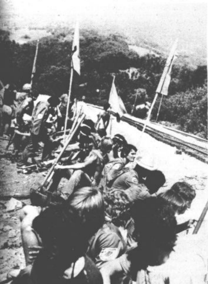
Brigadirji čakajo vlak, ki jih bo odpeljal do neselja