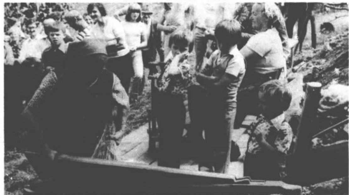
Najmlajši se seveda niso mogli načuditi, da je takole iz lanu mogoče narediti platno.

Tisoči obiskovalcev so se z veseljem pozdravili mlade iz pobratene občine Čajetina in predvsem pionirke in njihove starijše vrstnike iz Zelezne kaple na avstrijskem Koroškem. Množica se je povorko zgrnila proti Savinjskemu gaju, kjer so si tisoči še enkrat ogledali cvetje, v gaju in na vozilih gaju zagotovo ne zadnjič.