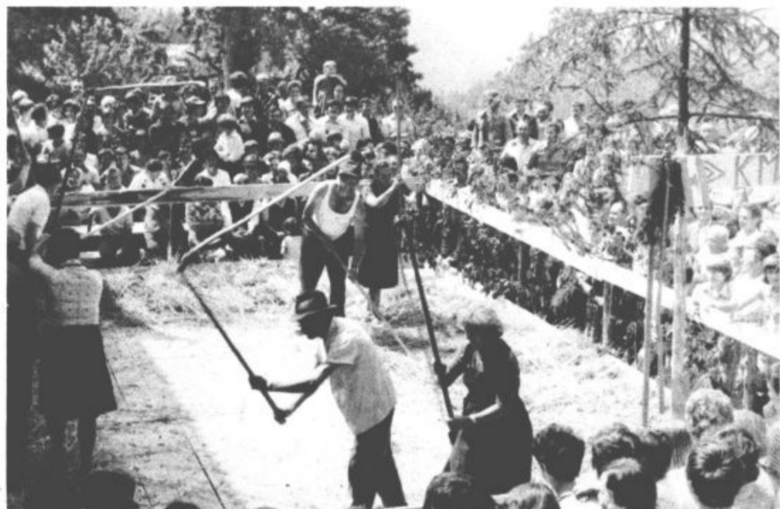
Izredno lepa sončna nedelja je v nedeljo pritegnila v Plešivec k Ževartovi domačiji na Kmečki praznik izredno veliko prebivalcev velenjske občine, ki so z velikim zanimanjem opazovali domačine pri obujanju starih kmečkih običajev. Med drugim so kmetje iz Plešivca pokazali tudi mlačeve pšenice in to ne v štiri, ampak kar v osem. Kljub temu, da so „cepce“ že zdavnaj spravili v zadnje kote senikov pa so bili pri tem starem kmečkem opravilu še vedno zelo spretni. Prav bi bilo, da bi takšna prireditev postala tradicionalna in da bi se staro kmečko izročilo oziroma običaji tudi tako prenašali iz roda v rod.

Člani izvršnega sveta skupščine občine Velenje so na zadnji seji, ob obravnavi ocene stanja pri izdelavi prostorskega plana občine Velenje in ukrepah za nadaljnje delo ter predloga