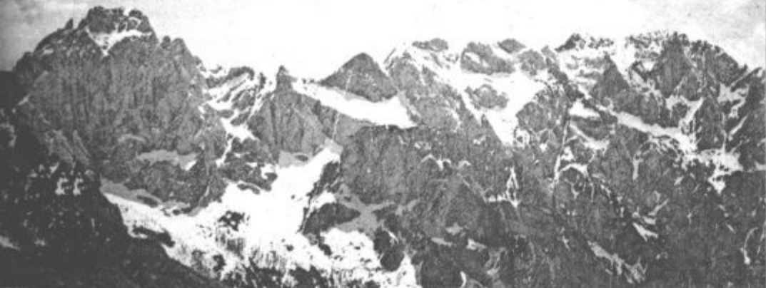
Nebotično severno ostenje Savinjskih alp nad Logarsko dolino

Naših gor ne damo za mehkužnost mest, študenti naši niso mlake ravnih cest, naš rod bo dalje pisal si povest o goram zvestobi, katerim ostal bo vedno zvest.