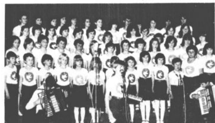
Pevci mladinskega zbora „57 deklci in dečkov“ iz Bugojna, ki bodo v tork nastopili v Velenju.