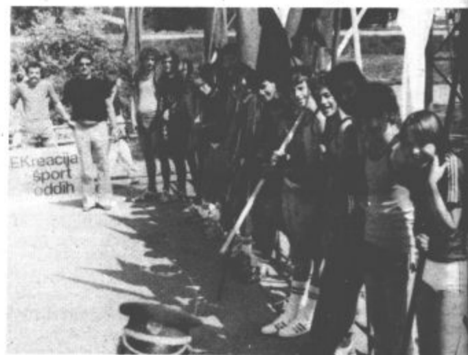
Mladi atleti Velenja dobro pripravljeno za republiško prvenstvo

Mladi odhajajo na to tekmovanje dobro pripravljeno, saj pred tem imeli skupne priprave na Pohorju. H. JEROMLJEVA