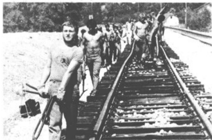
Pod žgočim soncem se rojeva nov tir

imeli tudi nekatere pripombe, predvsem pa željo, da se brigada v prihodnjih dneh še bolj izkaže in doseže na trasi še lepše in boljše rezultate, posebno še, ker nosi ime revolucionarnega pes-