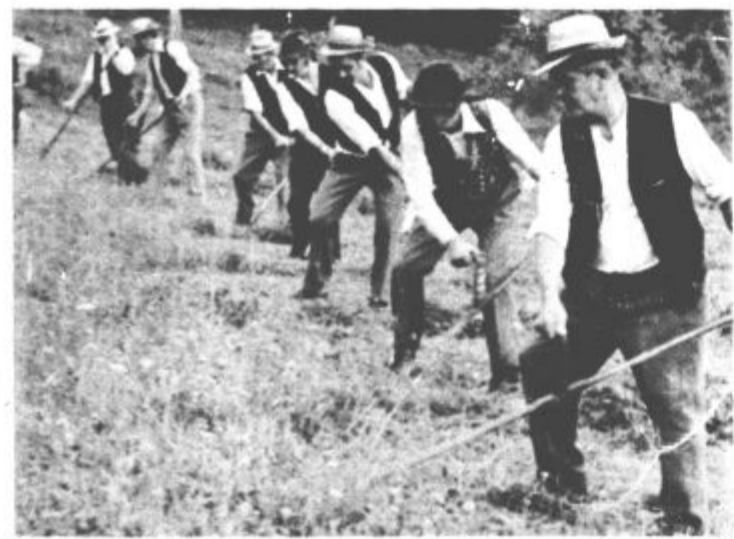
V eni vrsti 25 koscev — trava je padala kot za stavo in skoraj bi prekmalu končali