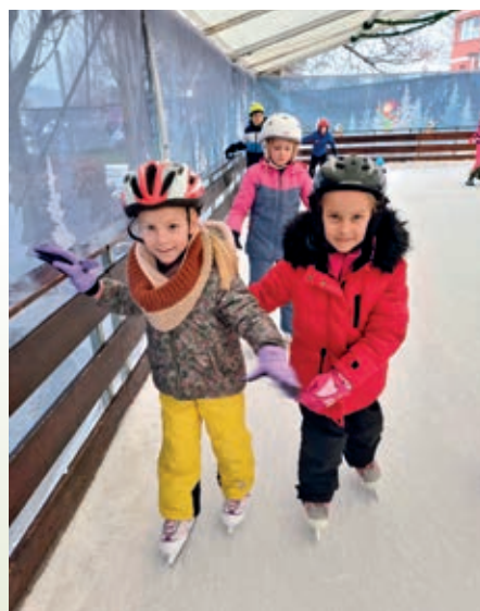
V družbi sošolke je lažje...