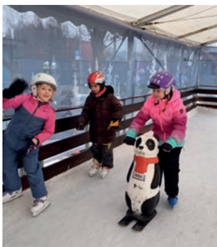
Za začetek s pingvinom in ob ograji