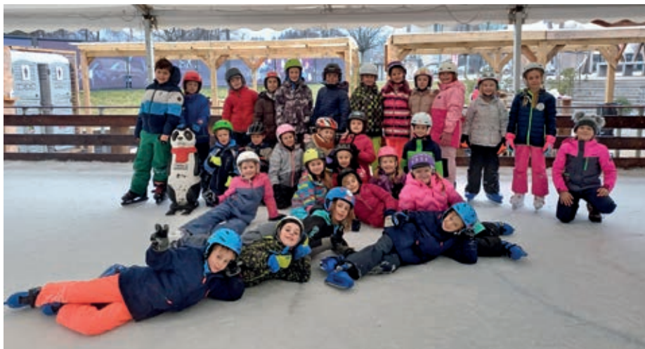
Gasilska - drsalci 2.c in 3.c PŠ Utik

Čeprav je bil dan bolj kisel in nekoliko deževen, pa smo s šolarji na drsališču v Medvodah preživeli čudovit športno-drsalni dopoldan. Prav gotovo pridemo še kdaj!!!