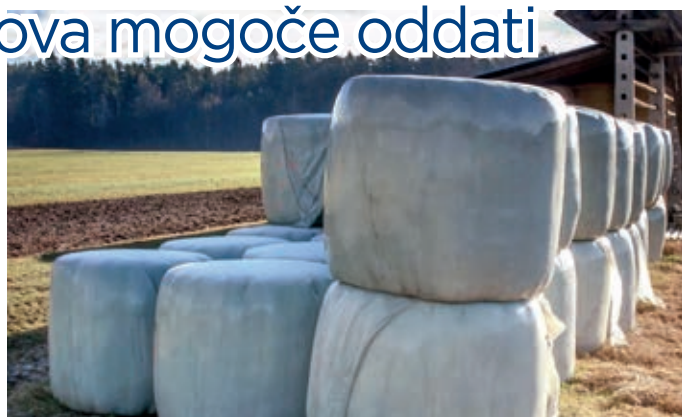
Simbolična fotografija (internet)

Poleg tega lahko na začasnem zbirnem centru v Vodicach občani skozi vse leto oddajo tudi druge vrste odpadkov, kot so: