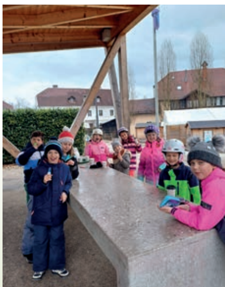
Odmor za malico, čaj, liziko...