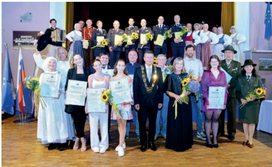
Podelitev občinskih priznanj Občine Vodice 2024

Naziv Častni občan Občine Vodice je najvišje priznanje občine, ki ga podeljuje Občinski svet posameznikom za njihove izjemne dosežke ali dejanja, s katerimi so prispevali k razvoju in ugledu občine. Naziv Častni občan Občine Vodice se podeljuje praviloma enkrat na štiri leta ob izteku mandata.