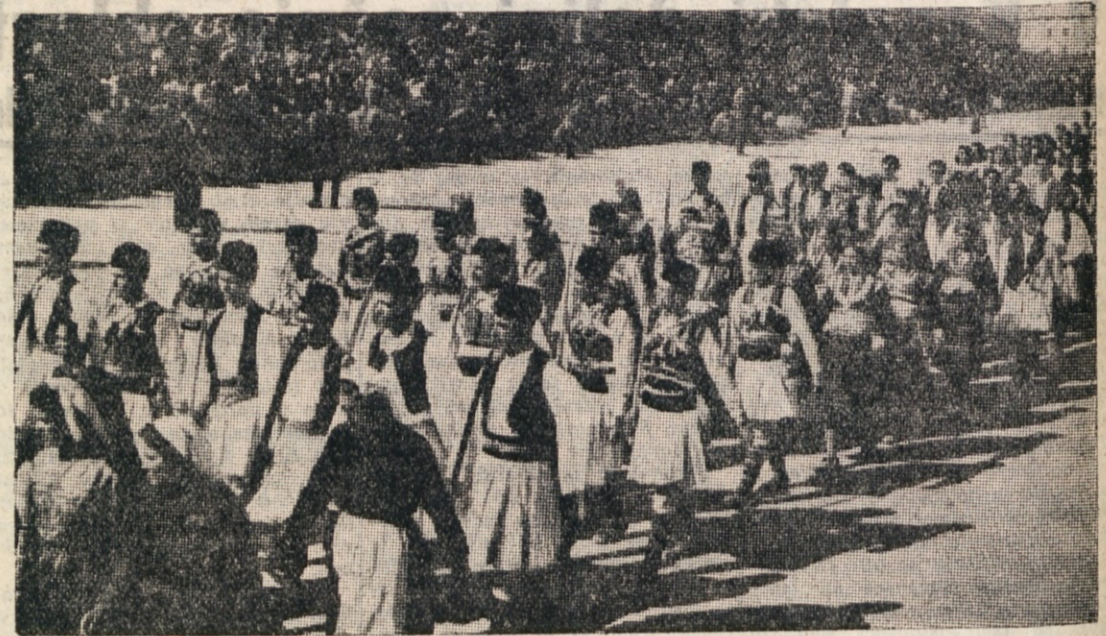
MAKEDONCI V PRVOMAJSKEM SPREVODU.

Njegove modre, bistre, a nekoliko zasajane oči se nasmejejo: «Ona je v našem hotenju, v naši volji in naši delavnosti. Sami vidite naš planinski svet pod seboj. Zadruga ga obsega 1.200 ha. Od tega je 280 ha pašnikov in 40 ha orne zemlje. Ostalo je gozd in goličava. Iz njega se pozimi prikladijo volkovi. Tudi letošnje zimo smo se ves čas borili z njimi. Tri pse so nam unčili, predno