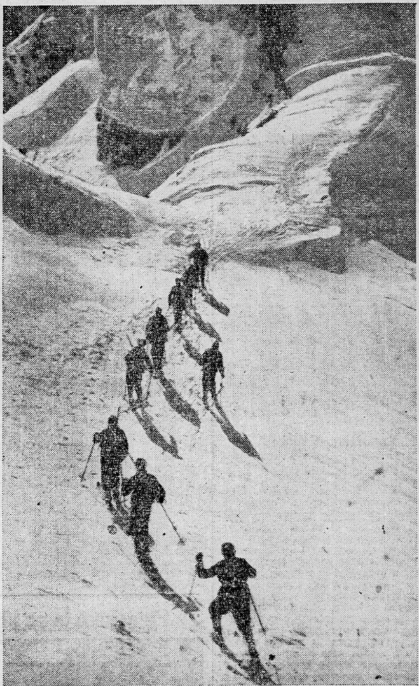
Vrnitev z vežbanja (Vratca pod Mojstranko).

gorska zavetišča, planinske kočje in ponosne domove s toliko ljubeznijo, znojneje čela in krvavih žuljev, zahtevalo, da se omogoči obisk gora nam, dihovnim ljudem iz industrijskih središč, rudarskih revirjev, gradbišč petletke, učilišč in pisarn. Za planince bo treba uvesti nedeljske povratne karte z znatnim popustom in drugimi ugodnostmi. Odločujočim ljudem je treba povedati, da se planinci iz Ljubne pripeljejo v Kamnik le za drag denar. Pojasniti moramo, da je alpinistom kovinarskih Jesenic nemogoče plačevati do Kranjske gore 100 din, ker se pripeljejo tovariši z Zidanega mosta v Kranjsko goro ceneje. Ako vsega tega ne bomo dosegli, smo zgoreli svoj cilj, v gorah ne bo več obi-