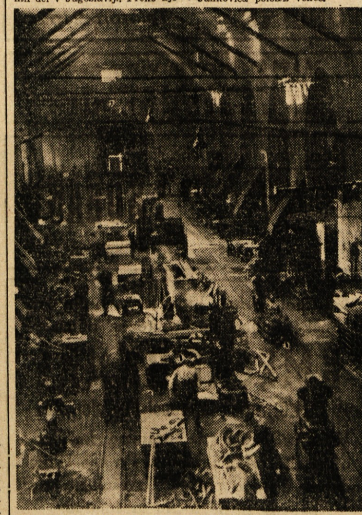
Obnovljena delavnica jeseniške tovarne med delom.

Leta 1942, v najusodnejšem času sovjetske države, v času, ko so bili težke boje v Stalingradu, so po naročbi generalisima Stalina avtomobilska tovarnica začela proizvajati nov lahki avtomobil, iz katerega se je razvil «ZIS-110». To dejstvo dokazuje trdno vero vsega sovjetskega ljudstva v zmago. Njegova konstrukcija upošteva vse najnovejše izsledke avtomobilske tehnike. Z gotovostjo lahko trdimo, da znatno prekaša vse sodbene evropske vzorce avtomobilov podobnega tipa. To dejstvo je še posebno značilno, če upoštevamo, da je ostala inozemska avtomobilska tehnika mnogo stariša od sovjetske avtomobilske industrije, ki je plod Staljinovih petletk. Toda kljub svoji mladosti je sovjetska avtomobilska industrija proizvedla izreden avtomobil in zagotovila