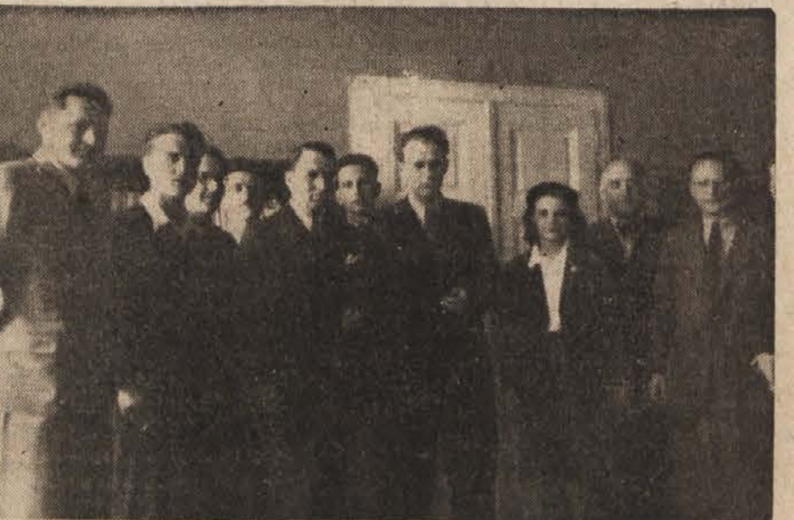
Na tiskovni konferenci, ki jo je imel g. veleposlanik z našimi novinarji