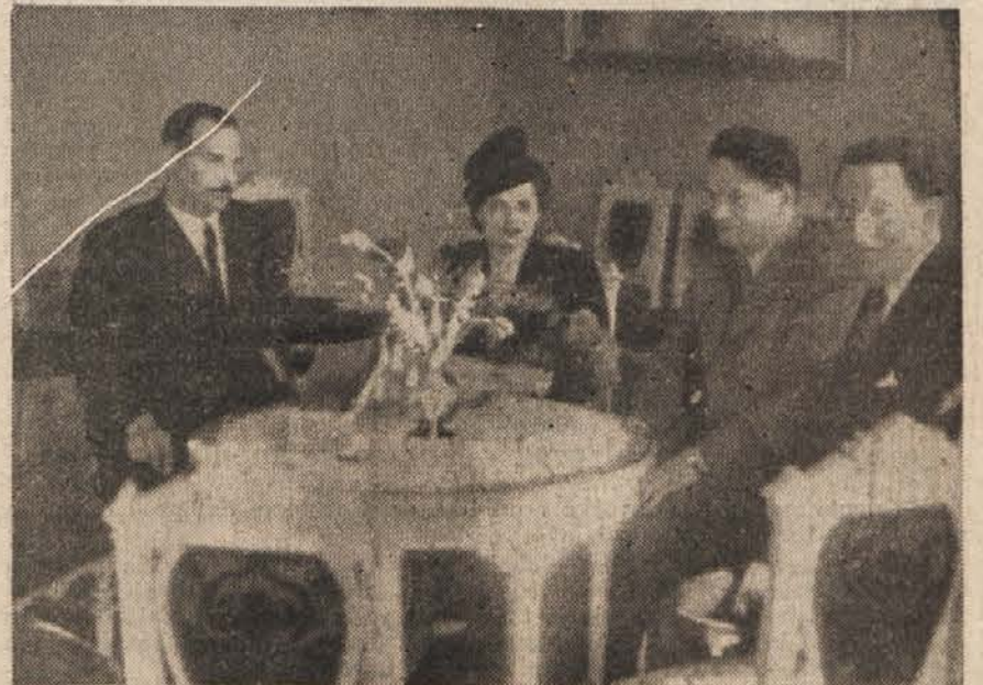
Veleposlanik češkoslovaške republike na predsedstvu vlade v prisrčnem razgovoru s predsednikom in podpredsednikom vlade LRS pred slovesom