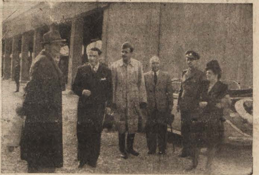
Na kolodvoru pred odhodom vlaka