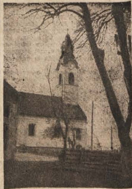
Cerkve pri Sv. Urhu

Cerkvica pri Sv. Urhu je bila med vojno spremenjena v trdnjavo. Zupnišče pa je služilo za zapore, v katerih so belogardisti do smrti mučili in pretepali naše najboljše ljudi.