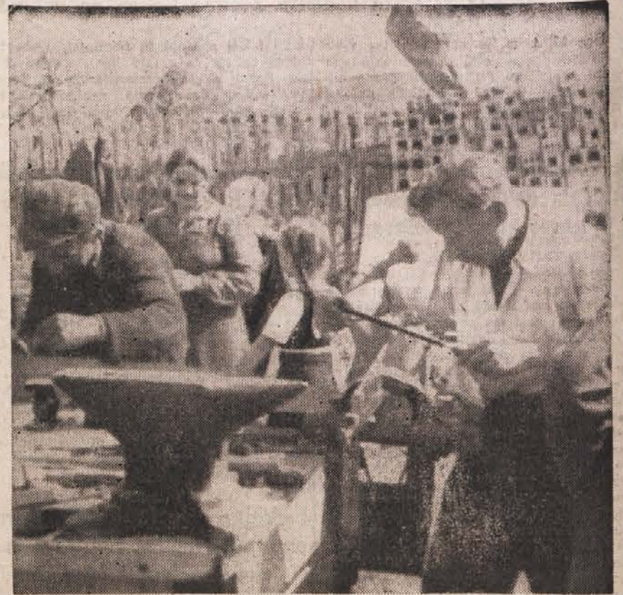
Kovači, kleparji, vārlici, mizarji in tesarji rudnika Rajhenburg so prihiteli v porušeno Planino, da pomagajo svojemu delovnemu tovarišu-kmetu