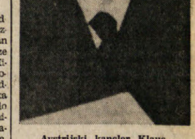
Avstrijski kancler Klaus

Vodstvo PRI je danes sprejelo stališče glede «paketa», pri čemer se je odločilo, da bodo podprli sprejem «paketa» ob določenih pogojih. V uradnem poročilu je rečeno, da so podrobno preučili zaskrbljenost lokalnih organov stranke, ki se namnaša predvsem na položaj Italijanov in uveljavitvi poslednje avtonomije bovenske pokrajine.