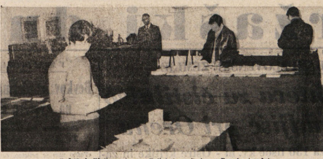
Z dveh knjižnih razstav: v Dolini (zgoraj) in na Proseku (spoda)

Knjiga "Tisoč milijard" — pravi mnogim — ne predstavlja nič drugega kot novo verzijo "Ameriškega izziva". In to ne samo po analizi podatkov, temveč tudi po zaključkih. Zelo razširjeno mnenje v Franciji pa je, da je "Ameriški izziv" bolj proameriška kot proevropska knjiga.