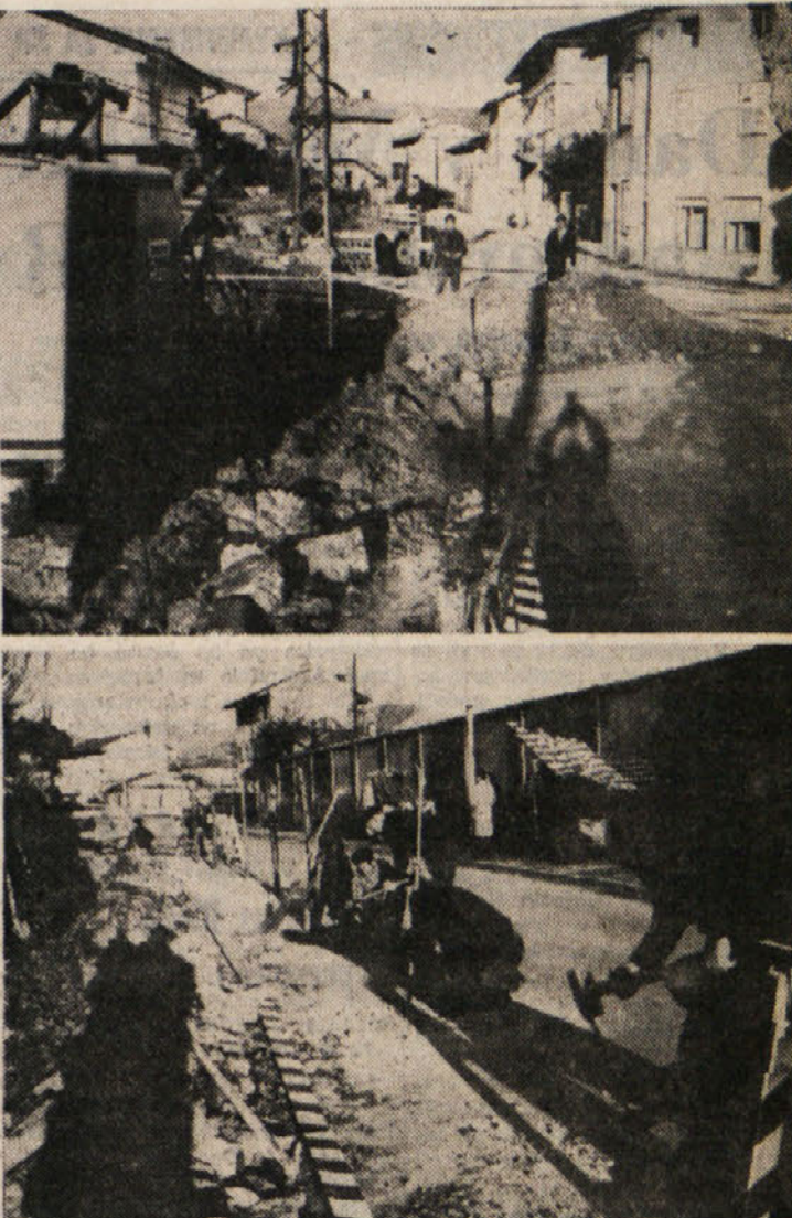
Občinska uprava se je odločila razširiti Ul. Attems in Ul. 4. novembra, obe v Podgori. Ul. Attems bodo tudi asfaltirali

V Podgori te dni širijo dve pomembni cesti. Stanovanci v Ul. Attems so končno dočkali, da se uresničujeta njihove zahteve, ki so jih v najrazličnejših oblikah naslavljali na občinsko upravo. Ze nekaj dni namreč cesto širijo z bagerjem, urejajo odtočne cevi za deževnico ter odstranjujejo zemljo, da bodo zgradili oporne zidove. Na takšen način bo cesta v vsej dolžini primerno razširjena. Ker je speljana vzdolž strnjene naselja, je za vaščane velikoga pomena.