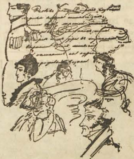
Iz Puškinovega rokopisa »Kavkaški ujetnik« z njegovimi risbami

Slaven bo ostal — po njegovi izjavi v gornji pesmi — tudi zato, ker je proslavljal dobroto in »padlim bil sem priprošnjik«. Tu se spet vrača k dekabristom, svojim »prijateljem, tovarišem in bratom«, kakor jih je imenoval. Ko mu je novi car Nikolaj 1826 preklical preganstvo ter ga vzel pod svojo »milost«, je Puškin nekaj časa pač verjel, da je bilo Nikolajevu krvavo zadnje dekabrističnega gibanja samo epizoda in da se utegne car obrniti v dobrotljivost, zase pa je upal, da bo za svoje književno delo užil vladjo večjo svobodo. V vsem se je kruto prevaral: res ni bil več preganjan v samotni vasi, toda bil je stalno nadziran, poniževan, njegove rokopise so