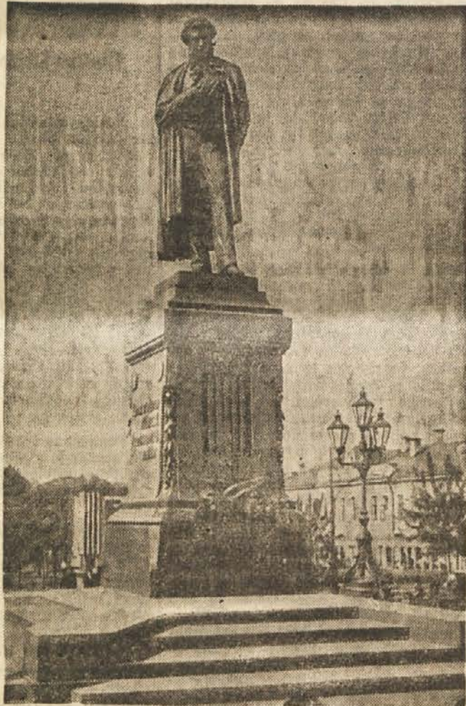
Spomenik A. S. Puškina v Moskvi (postavljen 1880, kipar A. Opekušin)

»Slaven bom ostal, dokler bo pod zvezdami prepeval le en sam poet.« Kar je napravil na vseh področjih literature, njegovo delo kot člana družbe in njegov vpliv kot direktnega, nesebičnega pedagoga — vse to mu je jamčilo večno slavo. Delo, ki ga je v vzgojnem smislu opravil s svojimi ustnimi ocenami, navesti, v svojih pismih poklicnim tovarišem, je enako važno, kakor delo, ki je ležalo tedaj tiskano pred njim. Kako vesel je bil vsakega nadarjenega novega književnika, kako jim je pomagal! Znano