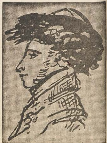
Aleksander S. Puškin (avtoportret)

Toda ljudstvo ga je poznalo in priznalo. Ko so načrtno zapletli Puškina v spletko zaradi njegove žene ter je bil v dvoboju ranjen in je po treh dneh umrl, je ta smrt vznemirila predvsem