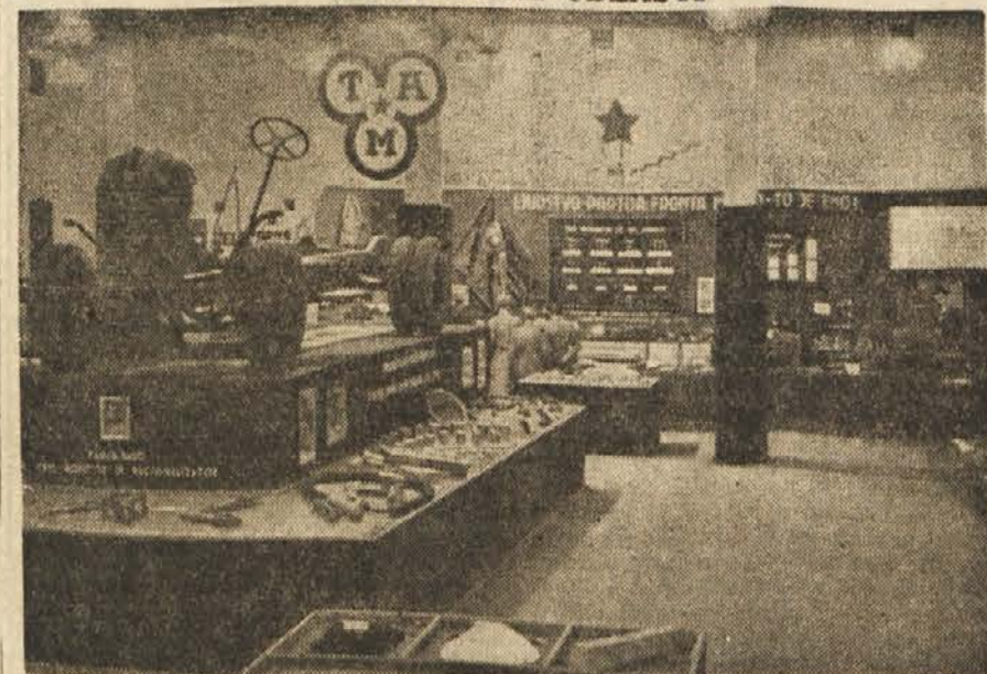
Novo vrste izdelkov, ki smo jih prej uvažali, so razstavile: avtomobilska tovarna, »Splošna stavbena«, železarna in livarna na Muti, guštanjska železarna, kemična tovarna v Rušah in tovarne lahke industrije