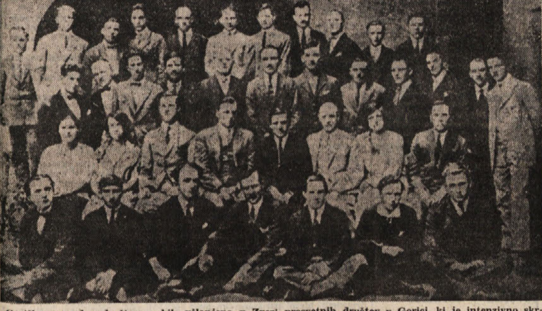
Goriška napredna društva so bila včlanjena v Zvezi prosvetnih društev v Gorici, ki je intenzivno skrbelo za razvoj prosvetnega dela. Temu so služili tudi razni tečaji. Slika prikazuje udeležence organizacijskega tečaja, ki je bil v Gorici 13. in 14. junija 1925