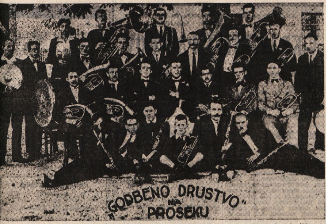
Godbeno društvo na prošeku. Godbena društva so imela v preteklosti veliko več možnosti za vaje in nastope. Na vseh važnejših prireditvah so poleg zborov nastopale godbe, v katerih se je do danes zvrstilo že nekaj generacij. Na sliki prošeska godba