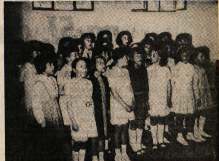
Prireditve je bila v šolski tofo-vadnici, ki je dovolj obsežna ter so jo za to priliko primerno opre-mili in okrasili. (J.)