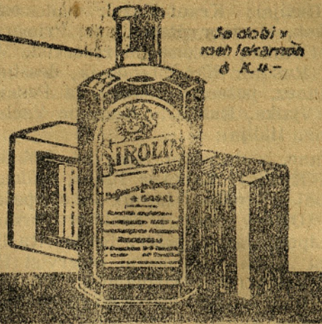
Se dobi v vseh lekarnah & K. A. -