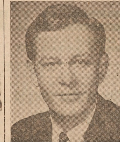
Okrajni avditor George Voinovich

stvar. Prireditve se vrši pod sponzorstvom Slovenskega narodnega doma na St. Clair Ave.