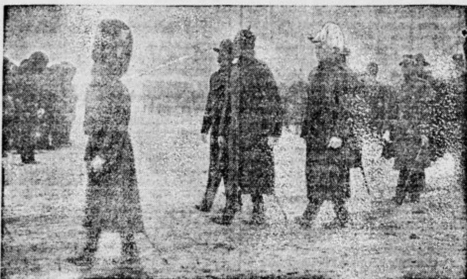
Za krsto stopa sin pokojnice, angleški kralj Jurij s prestolonaslednikom, za njima pa danski, norveški in belgijski kralji ter švedski, norveški in rumunski prestolonasledniki.