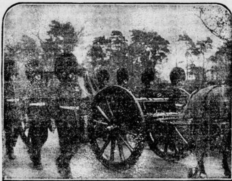
Krsto pokojne kraljice vozijo na topovski lafeti. Spremljajo jo gardni oficirji v stari tradicionalni uniformi.