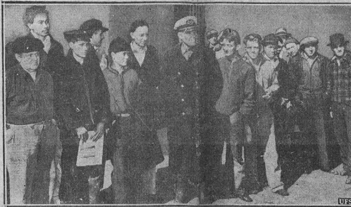
Na sliki je del moštva s pogreznjenega ameriškega parnika Lillian, ki je kolidiral v bližini obali države New Jersey z nemškimi parnikom Wicgandom, ki je pripeljal brodolovce v New York. Parnik Lillian se je potopil.