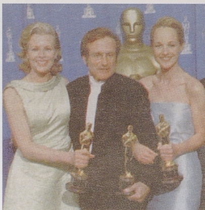
Robin Williams drugi z leve.

Glavni junak filma Will Hunting je dvajset let star fant iz Bostona - Willa Huntinga igra Matt Damon. Na prvi pogled je to navadni pobalin; rad hodi ven s prijatelji, včasih se napije ali koga natepe, podnevi pa se preživlja z opravljanjem preprostih del, tudi s čiščenjem poda v prestižnem bostonskem kolidžu. Značajsko je Will uporen fant; odraščal je sam, brez staršev in po sirotišnicah, zato je njegovo ob-