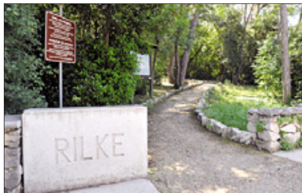
Začetek pešpoti Rilke v Devinu