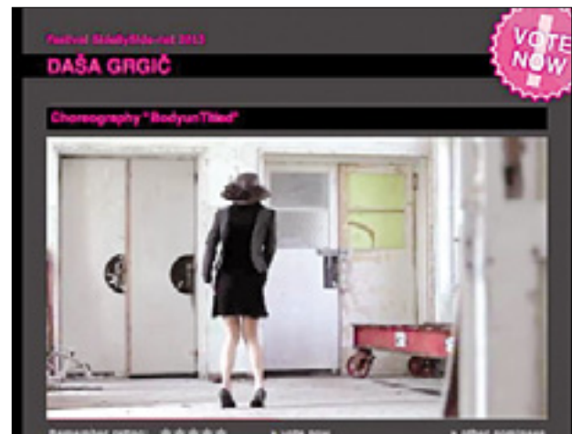
Daša Grgič na spletni strani SidebySide.net

Luca Quaija je po njem posnel krajši video, s katerim se je tržaška plesalka in plesna vzgojiteljica prijavila na mednarodni spletni plesni festival SidebySide. Organizatorji so med 151 prijavitelji iz 33 držav izbrali 10 finali-