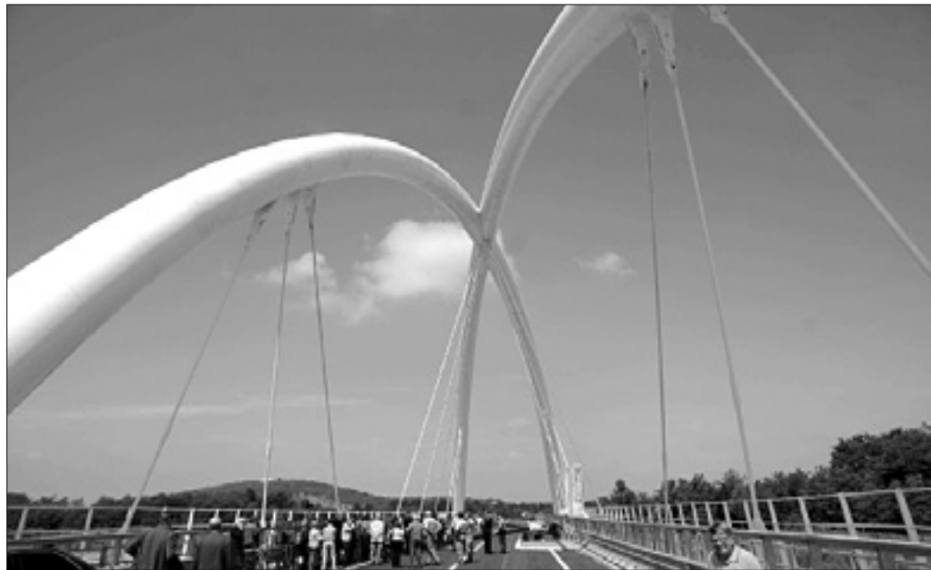
Nov most čez potok Birša