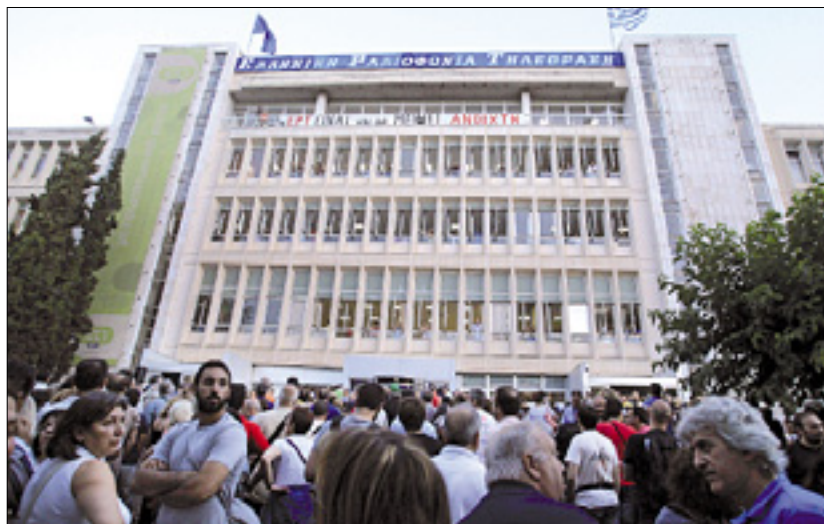
Uslužbenci pred glavnim sedežem radiotelevizije ERT

Napoved vlade pa prihaja po tem, ko so mednarodni posojilodajalci oziroma trojka - Evropska komisija, Evropska centralna banka (ECB) in Mednarodni denarni sklad (IMF) - Grčijo pozvali, da mora odpustiti več tisoč javnih uslužbencev. Grške oblasti morajo tako do konca leta odpustiti 4000 javnih uslužbencev, do konca leta 2014 pa 15.000. (STA)