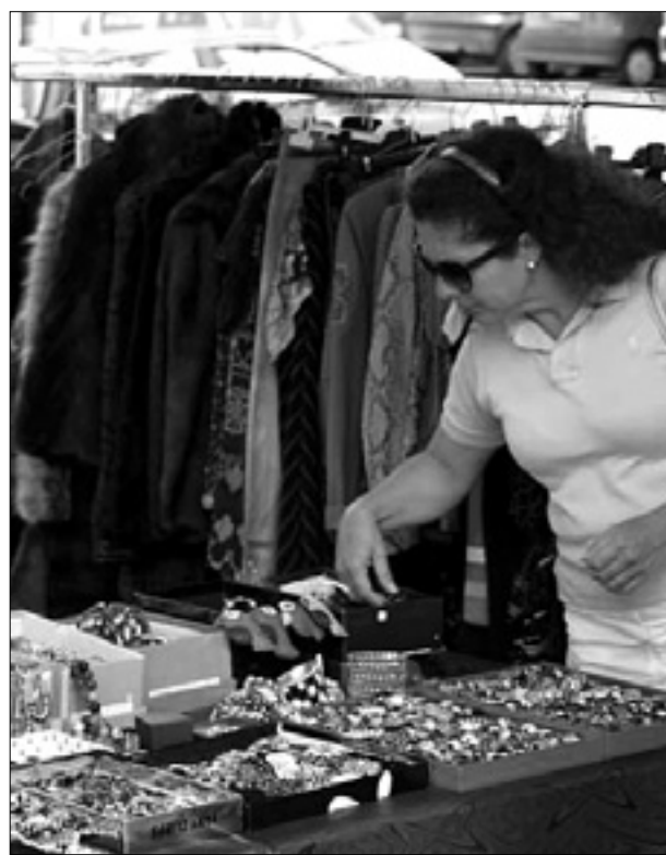
Bižuterija in tekstil (zgoraj); stara igrača (spodaj)