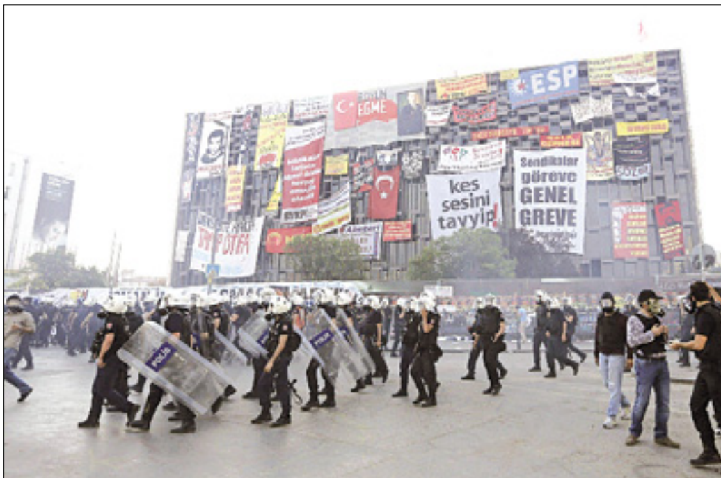
Policija zaseda Trg Taksim

Poleg tega je Erdogan včeraj napovedal ničelno toleranco do protestov. Sporočil je, da so demonstracije doslej terjale štiri smrtno žrtve, ob tem pa se je zahvalil vodstvu policije, katere nasilno posredovanje je branil v luči vandalizma protestnikov. (STA)