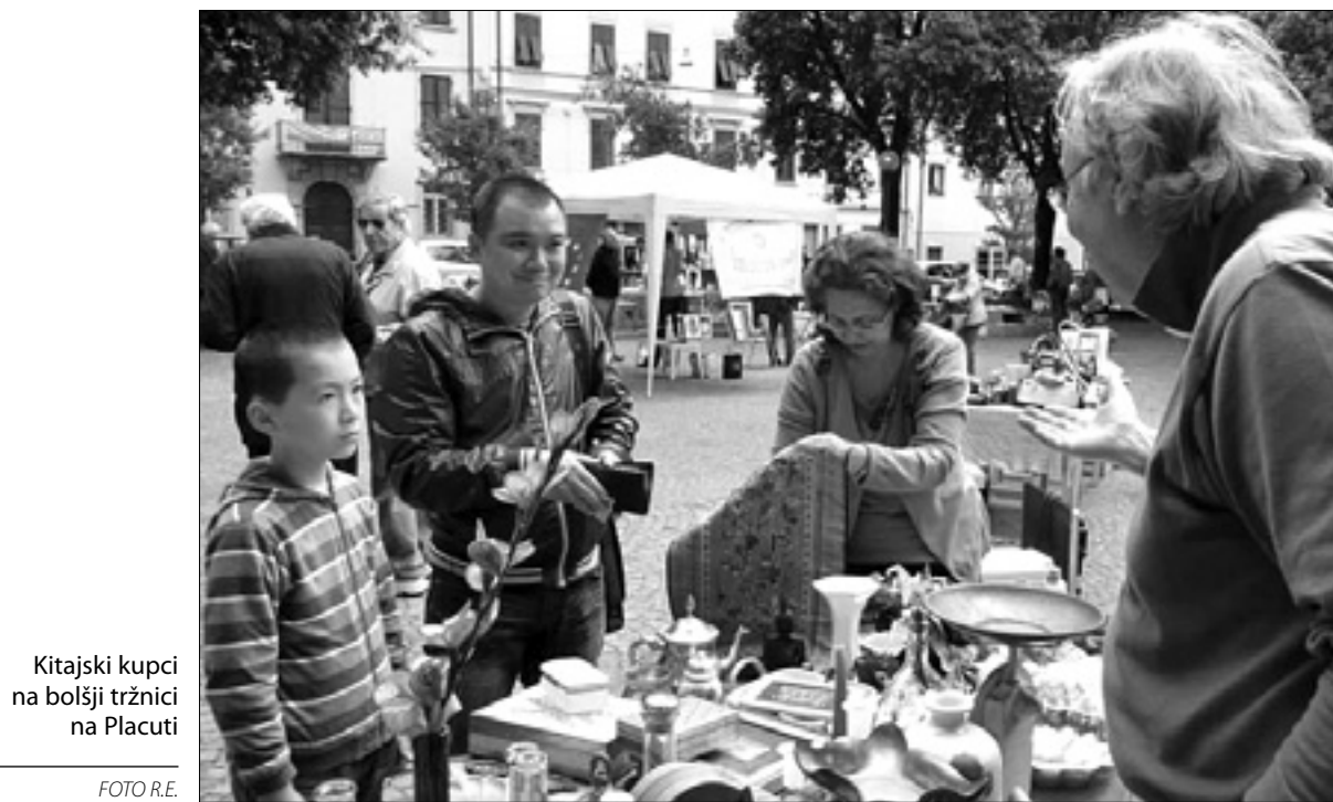
Kitajski kupci na boljši tržnici na Placuti