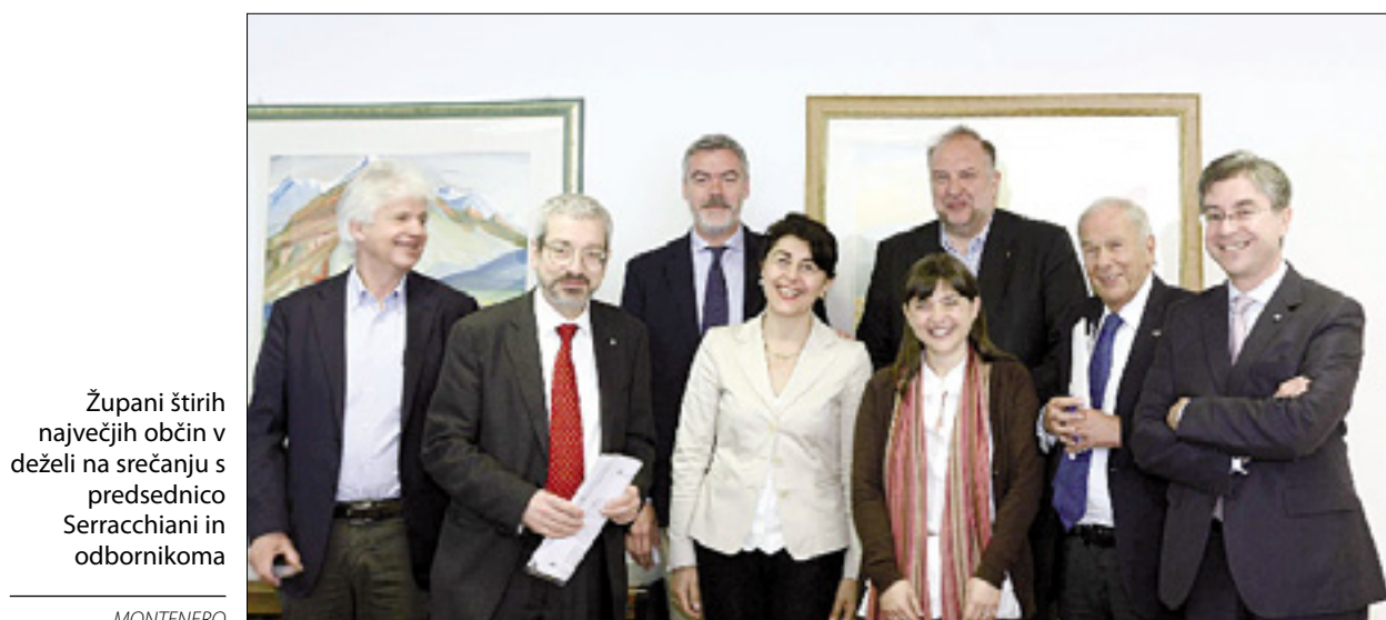
Župani štirih največjih občin v deželi na srečanju s predsednico Serracchiani in odbornikom