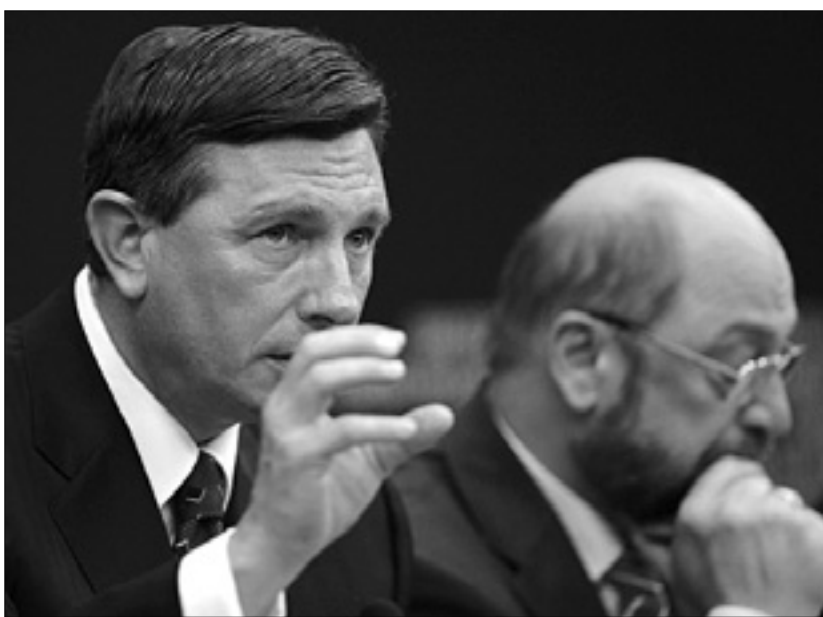
Borut Pahor in Martin Schulz