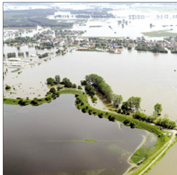
Poplavljena vas Fischdorf blizu Magdeburga v Nemčiji

Kosovo je leta 2008 razglasilo neodvisnost, kar Srbija še vedno zavrača. Aprila je bil sicer po dolgotrajnih pogajanjih in s posredovanjem EU dosežen dogovor obeh strani za normalizacijo odnosov, ki ga kosovski Srbi zavračajo. (STA)