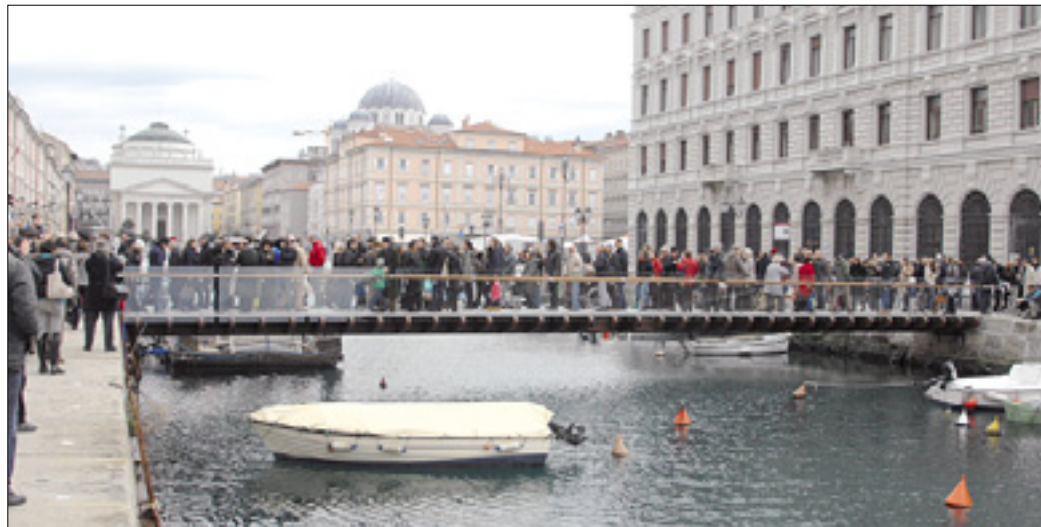
Nov most bo po novem Joyceov most

Javna branja, predavanja, predstave - Po irskem pisatelju bodo poimenovali nov most