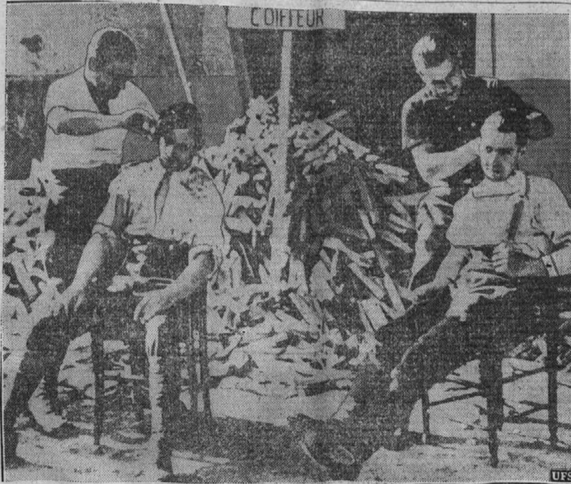
Prizor z zapadne fronte, kjer poleg vojnih dolžnosti tudi "brije, čese in striže." Modni saloni so poleg skladovalnice drv.