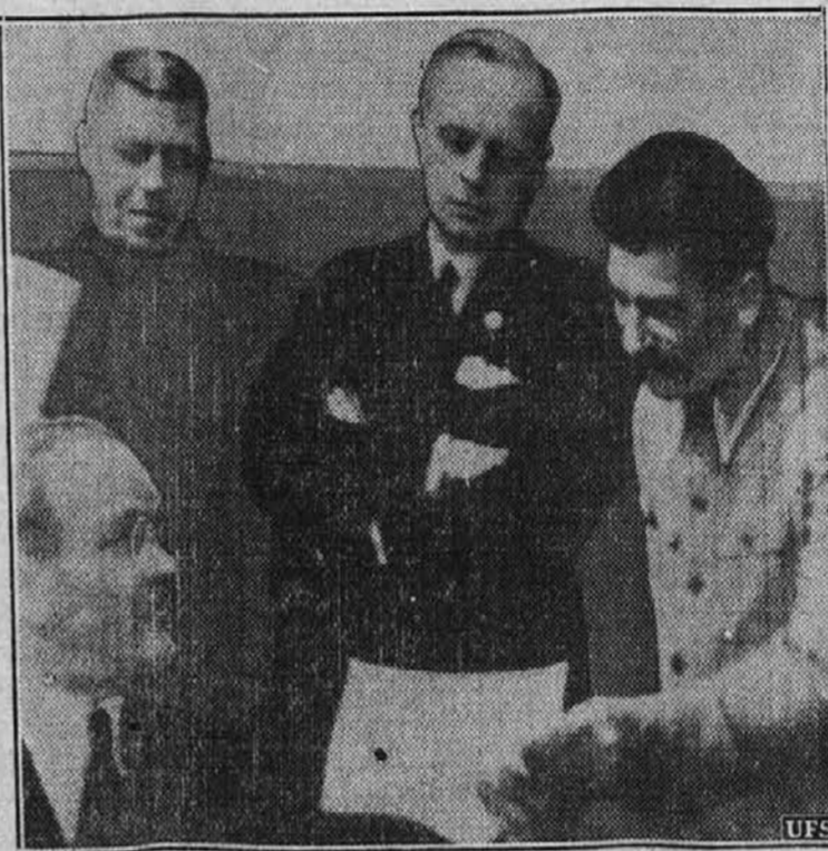
Od leve proti desni, ruski komisar zunanjih zadev Molotov, nemški zunanji minister von Ribbentrop in Jože Stalin, ki se mastijo nad malimi državami.